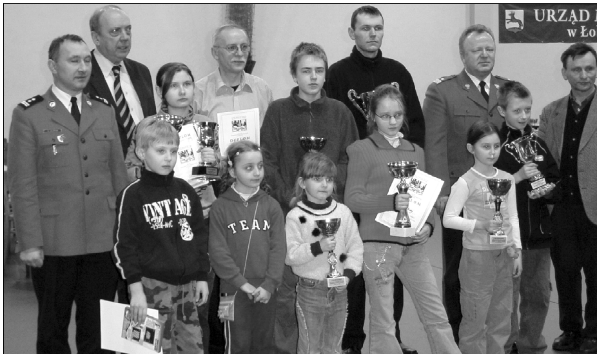
U góry młodzi szachiści w towarzystwie komendanta wojewódzkiego policji generała Andrzeja Gorgiela; poniżej Kazimierz Łaszewski rozgrywa partię w kat. „Open”, obok ze swoją ekipą.

Gryfickie szachy są już na niezłym poziomie, ale żeby pójść krok dalej trzeba pracy, czasu i pieniędzy. Od marca zaczynamy nowy etap szkolenia. Czas też się znajdzie. Czego jeszcze brakuje?