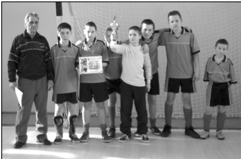
Polonia Płoty II miejsce