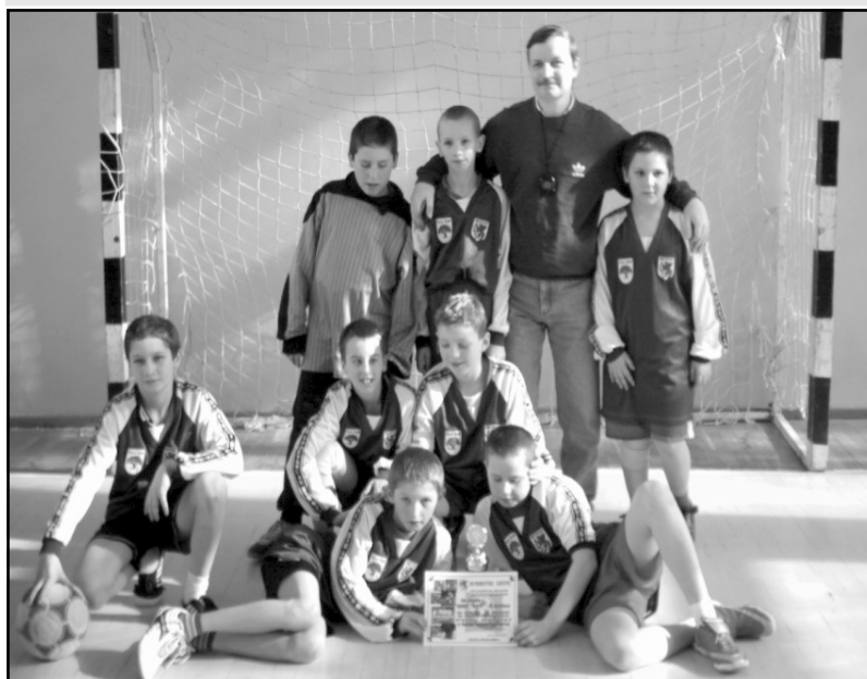
GUKS Gryf I miejsce