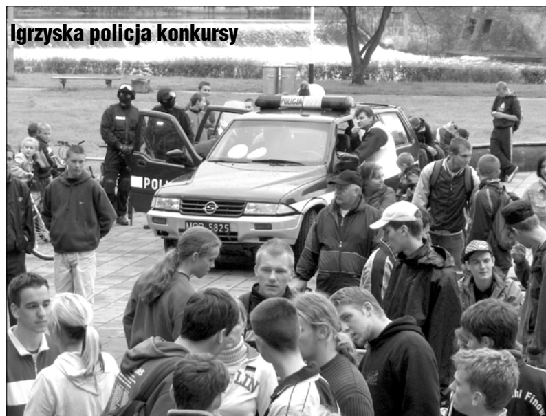
Igrzyska policja konkursy