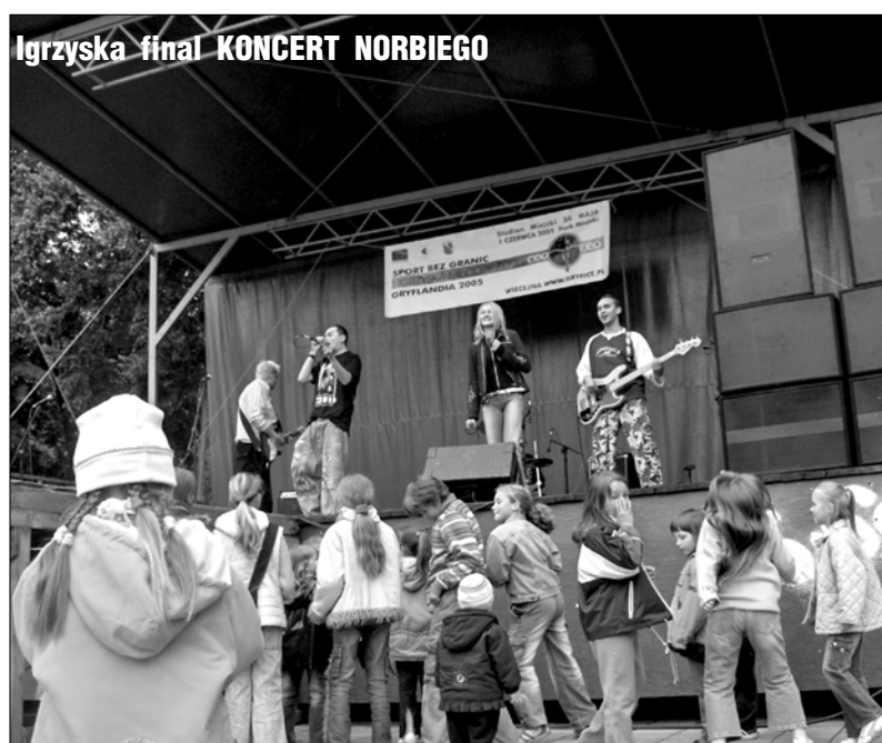
Igrzyska finał KONCERT NORBIEGO