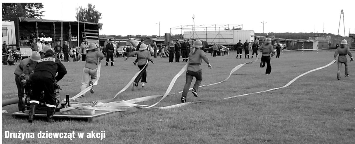
Drużyna dziewcząt w akcji

zespołów. W zawodach wystartowały 32 zespoły w różnych grupach wiekowych reprezentujące Gryfice, Górzycę, Kukań, Ościęcin, Przybiernówko, Rybokarty, Świeszewo i Trzygłowo. W kategoriach młodzieżowych, chłopców młodszych i starszych oraz dziewcząt starszych triumfowali strażacy z Trzygłowa. Wśród dziewcząt młodszych najlepsze okazały się reprezentantki Ościęcina, zaś w grupie najmłodszej bezkonkurencyjne okazały się „Trygławki” z Trzygłowa. W kategorii seniorów reprezentanci Trzygłowa nie wytrzymali presji własnej publiczności, popełnili kilka błędów i zajęli dopiero piąte miejsce, triumfowali strażacy z Ościęcina, przed reprezentacją Górzycy i Rybokartów. Podsumowując, należy przede wszystkim podkreślić fakt ogromnego zaangażowania się całej społeczności lokalnej w zorganizowanie i przebieg imprezy. Świadczy to o tym, że można w naszym kraju wiele zrobić i nie musi królować poczucie powszechnej niemożności i oczekiwanie, że może ktoś coś nam zrobić. Na naszym terenie, naszej wsi, gminy, miasta - sami musimy pokazać, że tutaj to my jesteśmy gospodarzami. Stanisław Razmus