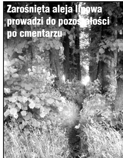
Zarośnięta aleja lipowa prowadzi do pozostałości po cmentarzu

Szcątki niemieckie trafią na cmentarz w Glinnej, w gminie Stare Czarnowo. Niemcy wykupili tam kilka hektarów i chowają wszystkich odnalezionych na terenie województwa zachodniopomorskiego.