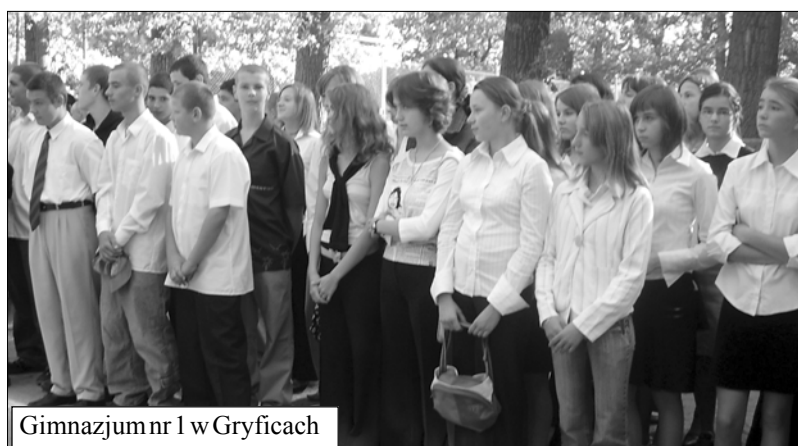
Gimnazjum nr 1 w Gryficach