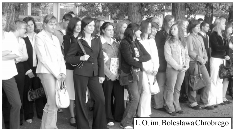
L.O. im. Bolesława Chrobrego