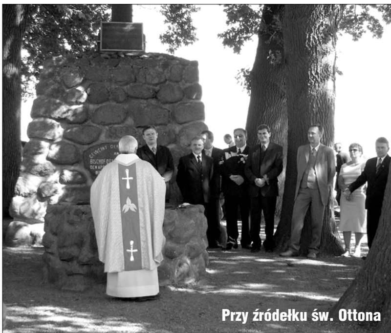
Przy źródleku św. Ottona

Pierwsza niedziela września to święto rolników z terenu powiatu pryfickiego. Uroczyste dożynki zorganizowane zostały w Cerkwicy.