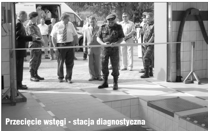
Przecięcie wstęgi - stacja diagnostyczna