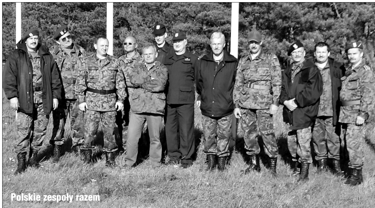
Polskie zespoły razem

Kolejna konkurencja - strzelanie z karabinu i tutaj podobnie - statyczne na sto metrów oraz dynamiczne do pojawiających się sylwetek.