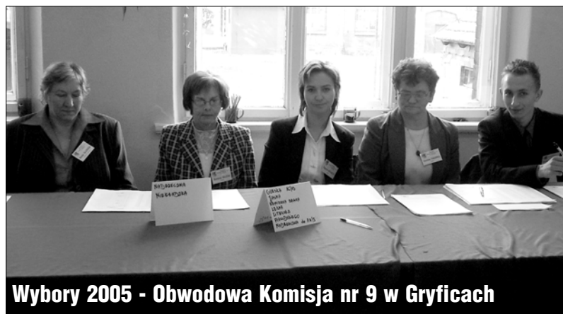
Wybory 2005 - Obwodowa Komisja nr 9 w Gryficach

„Jak na razie wszystko dobrze przebiega. Jest spokojnie. Frekwencja jest taka w miarę, no w miarę przyzwyczajona – może być. Najwięcej ludzi przychodzi po mszach, ale mimo to sprawnie nam tu wszystko idzie. Porównując te wybory prezydenckie do tych sprzed dwóch tygodni, to mogę powiedzieć, że jest bardzo podobnie, prawie tak samo. Ale jest jeszcze dużo czasu, kilkanaście godzin, więc coś może ulec zmianie.”