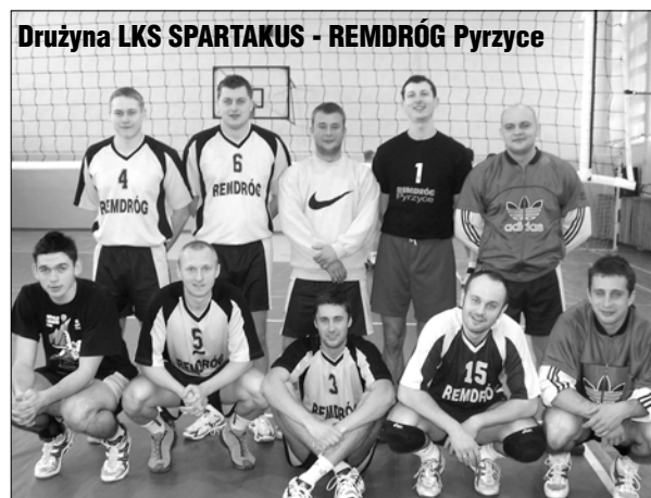
Drużyna LKS SPARTAKUS - REMDRÓG Pyrzyce