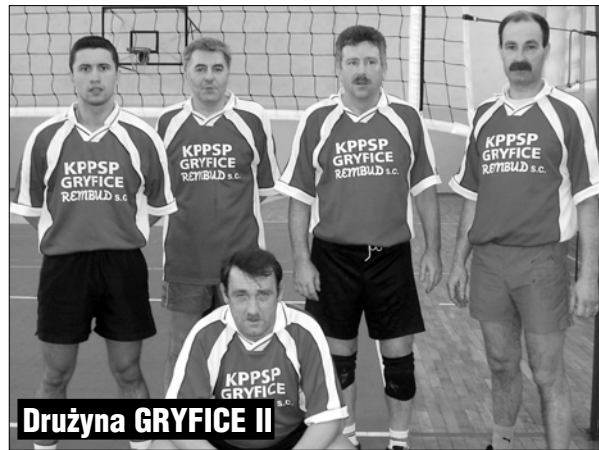
Drużyna GRYFICE II

Odszedł od nas 24 stycznia 1999 roku po ciężkiej chorobie.