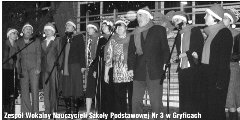
Zespół Wokalny Nauczycieli Szkoły Podstawowej Nr 3 w Gryficach