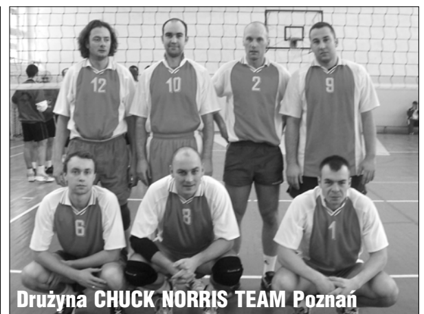
Drużyna CHUCK NORRIS TEAM Poznań