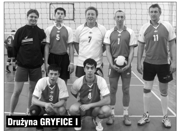
Drużyna GRYFICE I

W sobotę tj. pierwszego dnia Memoriału drużyny grały w dwóch grupach: Grupa A: ENTERPRISE Szczecin, CHUCK NORRIS TEAM Poznań, Gryfice II.