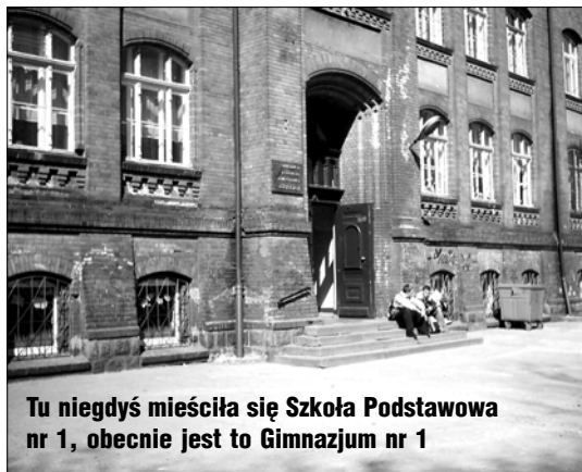
Tu niegdyś mieściła się Szkoła Podstawowa nr 1, obecnie jest to Gimnazjum nr 1