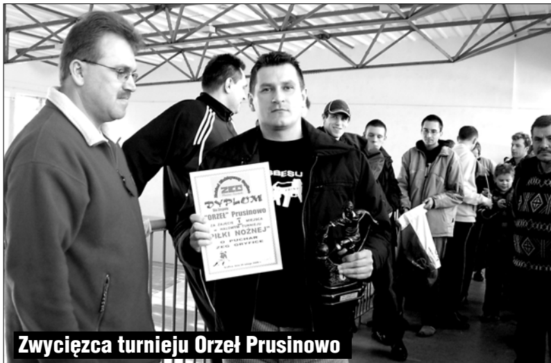
Zwycięzca turnieju Orzeł Prusinowo

W sali sportowej Szkoły Podstawowej nr 3 w Gryficach w minioną niedzielę, 26 stycznia br. zakończono trwający trzy miesiące turniej Gryfickiej Halowej Amatorskiej Ligi Piłkarskich Czwórek.