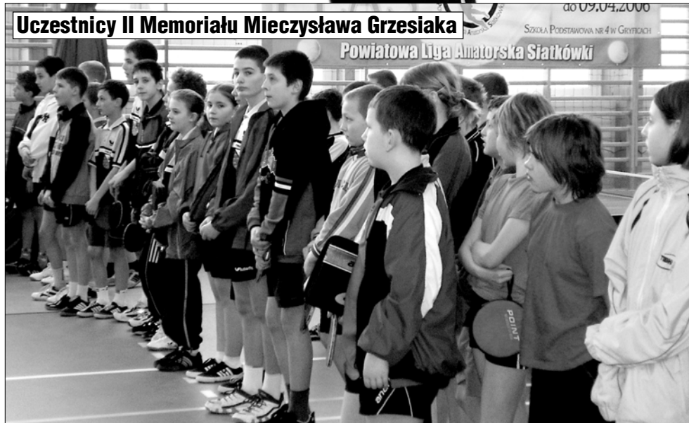
Uczestnicy II Memoriału Mieczysława Grzesiaka