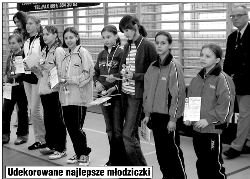
Udekorowane najlepsze młodziczki