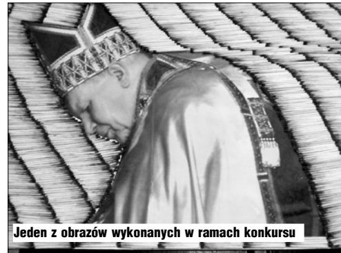
Jeden z obrazów wykonanych w ramach konkursu