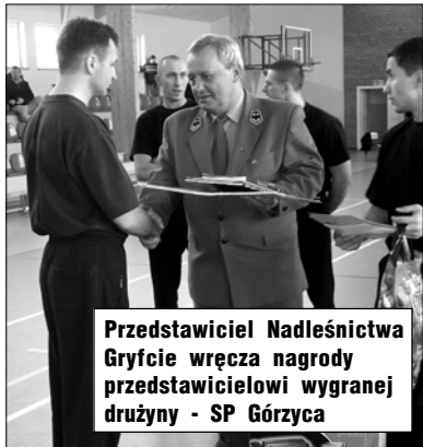
Przedstawiciel Nadleśnictwa Gryfice wręcza nagrody przedstawicielowi wygranej drużyny - SP Górzycza

Dzięki zorganizowaniu tego typu turnieju dzieciaki miały okazję nie tylko dobrze się bawić, ale również dowiedzieć się wielu pożytecznych rzeczy. Żwirek