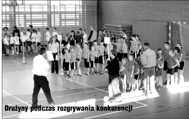
Drużyny podczas rozgrywania konkurencji

Strażacy przygotowali dzieciom 12 konkurencji, wśród nich były między