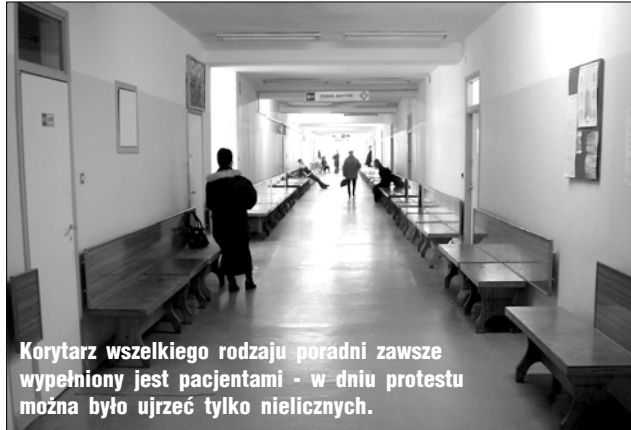
Korytarz wszelkiego rodzaju poradni zawsze wypełniony jest pacjentami - w dniu protestu można było ujrzeć tylko nielicznych.