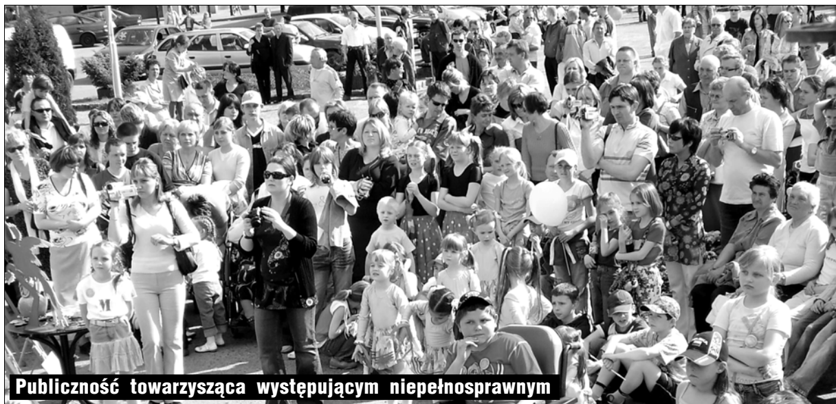
Publiczność towarzysząca występującym niepełnosprawnym