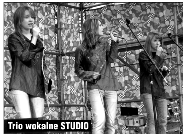
Trio wokalne STUDIO