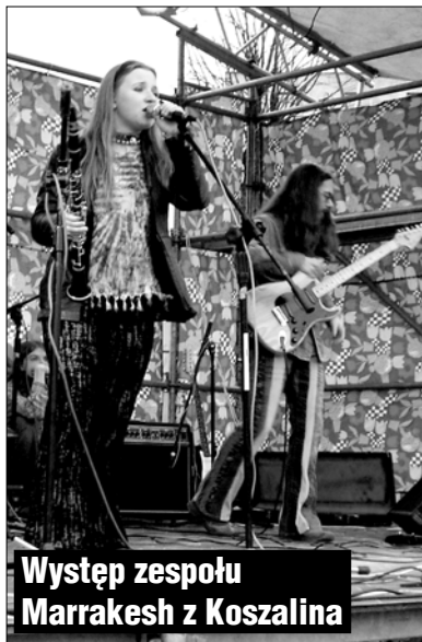
Występ zespołu Marrakesh z Koszalina

W dniach 1-3 maja br. na Placu Zwycięstwa w Gryficach odbyła się Gryficka Majówka.