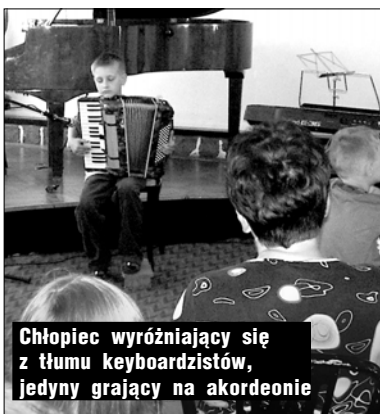
Chłopiec wyróżniający się z tłumu keyboardzistów, jedyny grający na akordeonie