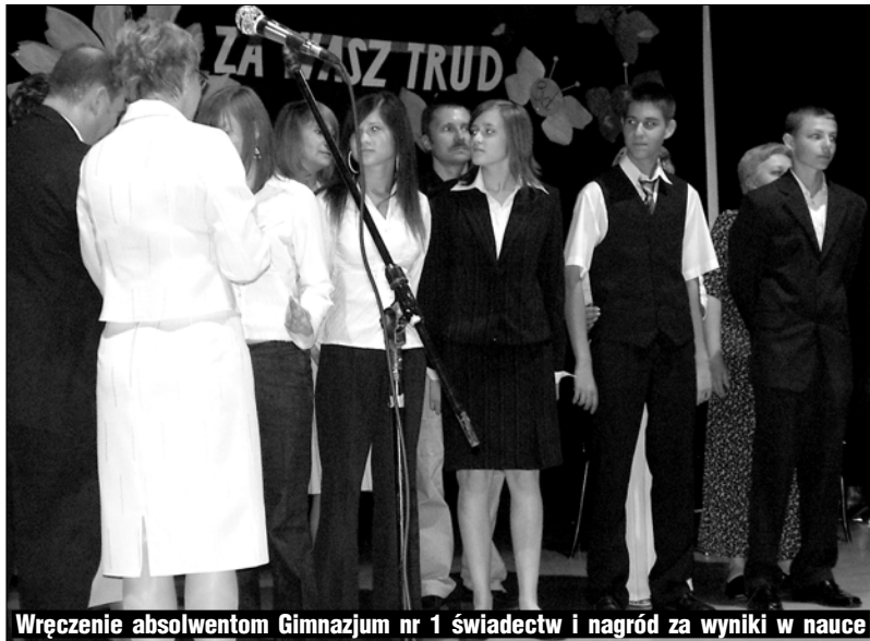
Wręczenie absolwentom Gimnazjum nr 1 świadectw i nagród za wyniki w nauce

Po trzech latach nauki w gimnazjum, uczniowie pójdą w dalszą drogę edukacji szkolnej. Przed nimi otworem stoją licea, technika i szkoły zawodowe. To, jaką decyzję podejmą i którą szkołę wybiorą będzie zależała ich przyszłość i dalsza edukacja, np. na szkołach wyższych. Żwirtek