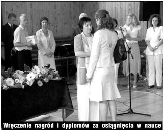
Wręczenie nagród i dyplomów za osiągnięcia w nauce