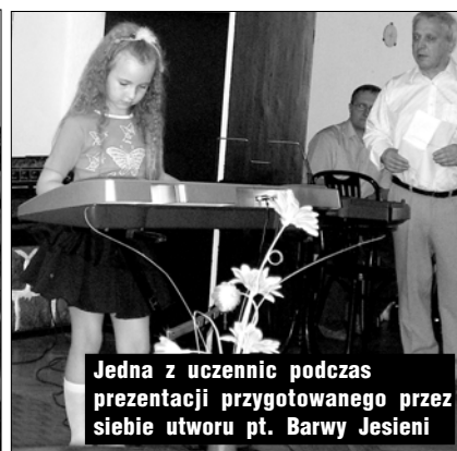
Jedna z uczennic podczas prezentacji przygotowanego przez siebie utworu pt. Barwy Jesieni