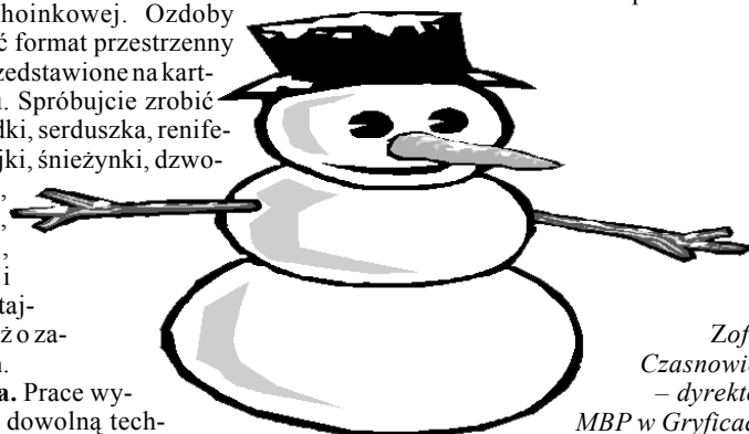
Zofia Czasnowicz – dyrektor MBP w Gryficach

Serdecznie zapraszamy wszystkich autorów prac.