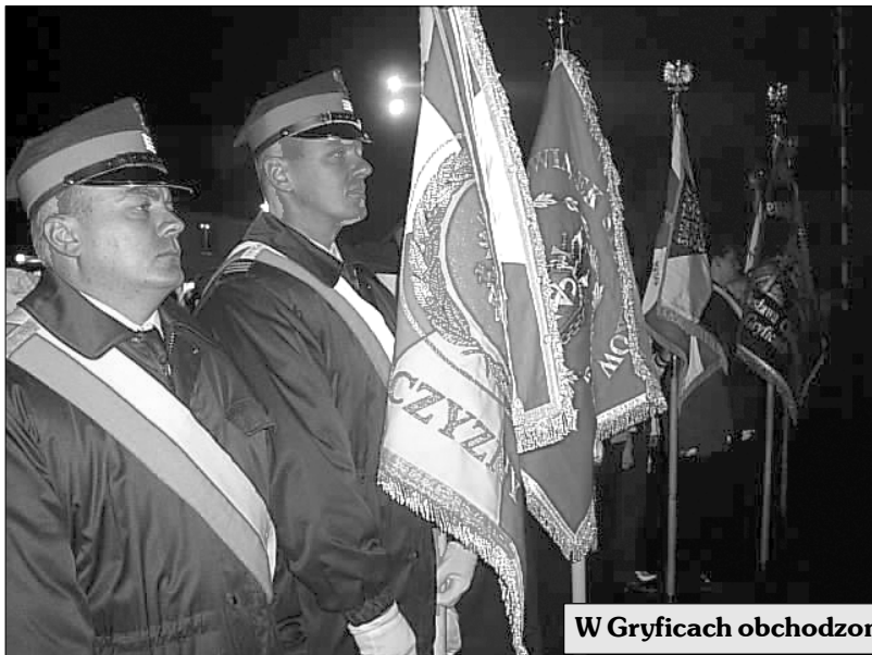
W Gryficach obchodzone Dzień Niepodległości