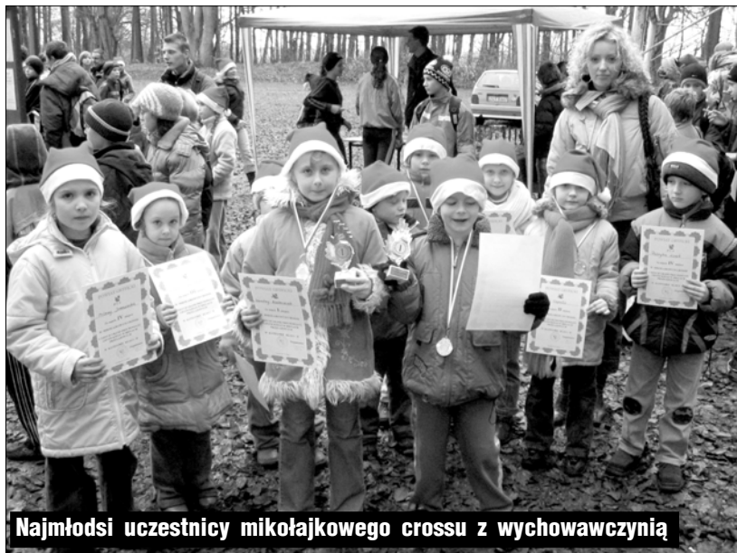
Najmłodszy uczestnicy mikołajkowego crossu z wychowawczynią