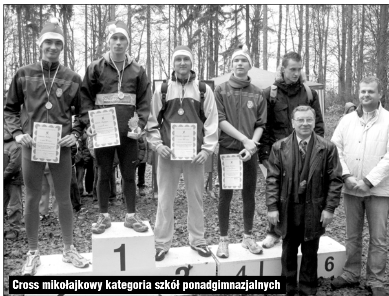
Cross mikołajkowy kategoria szkół ponadgimnazjalnych

(GRYFICE) 5 grudnia w Parku Miejskim w Gryficach odbył się Mikołajkowy Cross Przełajowy zaliczany do V edycji Grand Prix Powiatu Gryfickiego w Biegach Przełajowych. W zawodach uczestniczyło 220 zawodników, co na tę porę roku było zaskoczeniem dla organizatorów. Duża liczba startujących i wyrównana stawka walczą-