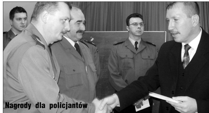
Nagrody dla policjantów