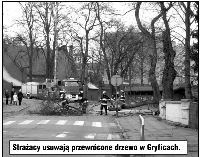
Strażacy usuwają przewrócone drzewo w Gryficach.

Godz. 09:58 Kołomąc – samochód uderzył w drzewo. Kierowca jadący sam. osobowym VW Golf czołowo uderzył w drzewo. Działania straży polegały na zabezpieczeniu miejsca zdarzenia, odłączeniu akumulatora, wydobywaniu osoby poszkodowanej na