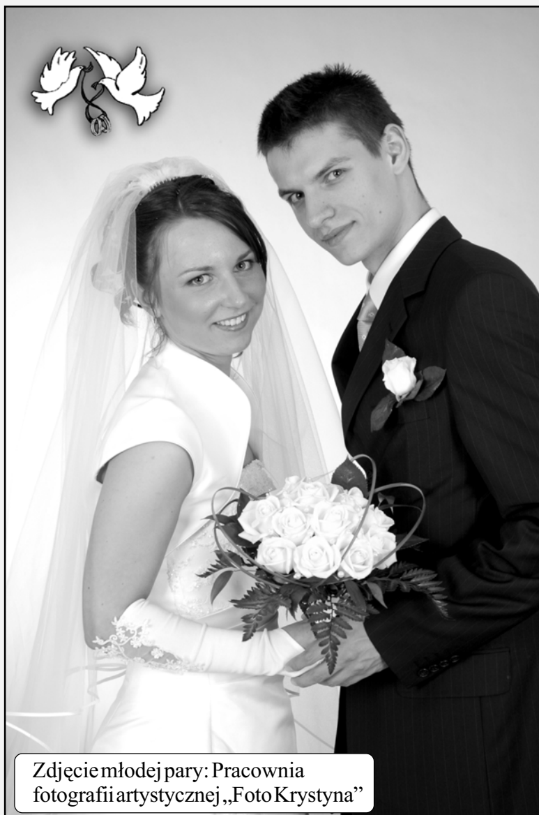
Zdjęcie młodej pary