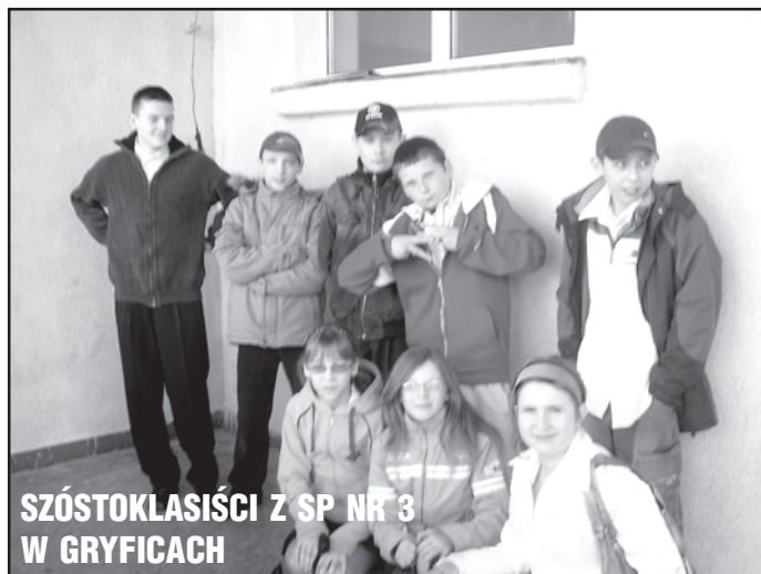
SZÓSTOKLASIŚCI Z SP NR 3 W GRYFICACH

sześciu klas VI-tych, a w SP nr 4 – 94 uczniów z czterech klas VI-tych. Udaliśmy się do pierwszej z tych szkół, aby spytać szóstoklasiistów o wrażenia z egzaminu. Aleksandra – jedna z uczennic – powie-