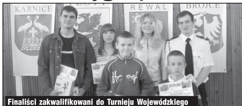
Finaliści zakwalifikowani do Turnieju Wojewódzkiego

W dniu 16 kwietnia odbyły się powiatowe eliminacje Ogólnopolskiego Turnieju Wiedzy Pożarniczej „Młodzież zapobiega pożarom”. W półfinale zmierzyło się ze sobą 36 dzieci, w trzech kategoriach wiekowych: szkoły podstawowe, gimnazja i szkoły ponadgimnazjalne. Do finału zakwalifikowało się po 5 osób z każdej grupy. Szóstka najlepszych (dwoje zawodników z każdej kategorii) weźmie udział w konkursie wojewódzkim, który odbędzie się 28 kwietnia, w SP nr 3 w Gryficach. Poniżej przedstawiamy wyniki punktowe: