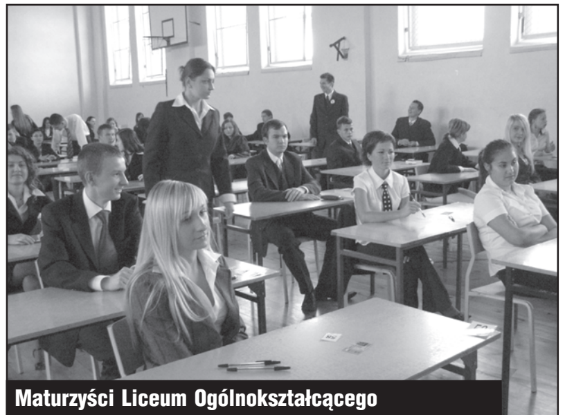
Maturzyści Liceum Ogólnokształcącego

W Liceum Profilowanym wszyscy, czyli 56 osób, zdawało podstawowy język polski, język angielski roz-