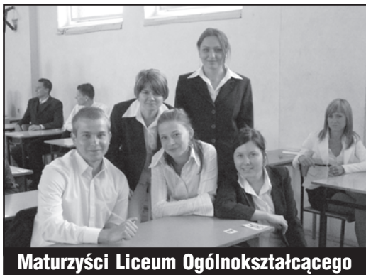
Maturzyści Liceum Ogólnokształcącego

cze poczekamy – tak, jak na kolejne rewolucyjne pomysły ministrów, którym chyba spodobało się przeprowadzanie doświadczeń na „bezbrownych” maturzystach. Przypominamy im również, że niestety jeszcze tylko w tym roku obowiązuje giertychowa amnestia, a potem trzeba będzie liczyć tylko na własną wiedzę i cierpliwość do kolejnych nieprzewidywalnych zmian! (mś)