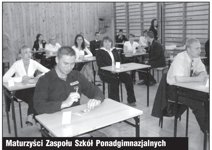
Maturzyści Zespołu Szkół Ponadgimnazjalnych

szerzony 8 z 27, a WOS rozszerzony 8 z 27. Z kolei w Liceum Ogólnokształcącym aż 3 z 54 uczniów zdecydowało się na rozszerzony język polski, 1 z 45 zdecydował się na rozszerzony niemiecki, a 5 z 22 zdaje rozszerzony WOS.