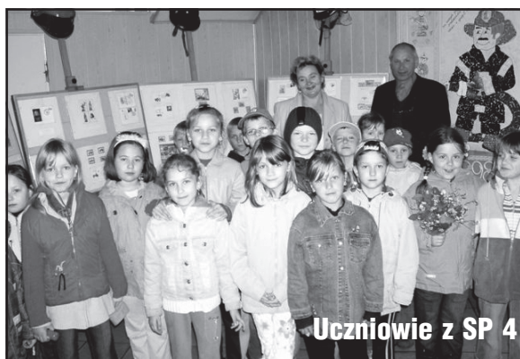
Uczniowie z SP 4

Przy okazji na pierwszym piętrze galerii obejrzeć można wystawę zdjęć ukazujących przedwojenną i powojenną architekturę oraz zabudowę Gryfic. Galeria zaprasza. (maja)