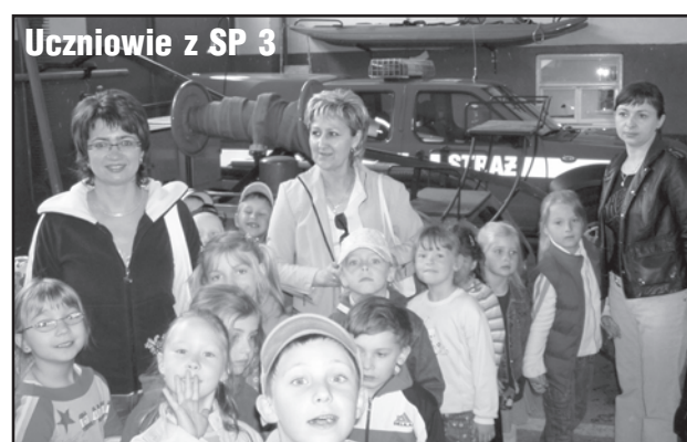
Uczniowie z SP 3