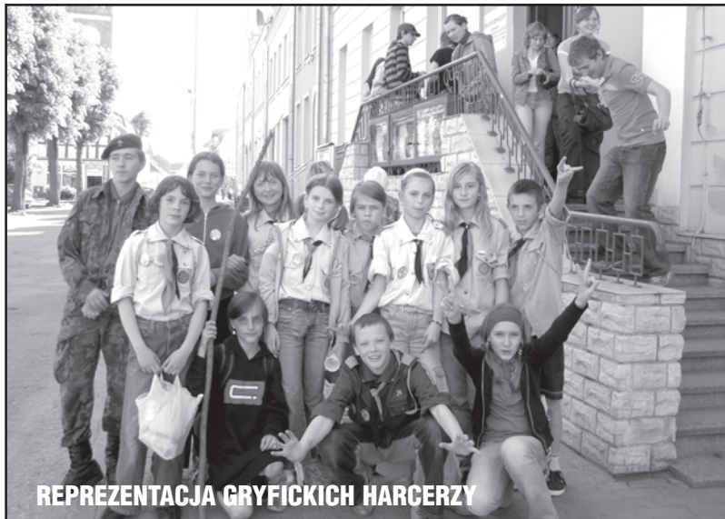
REPREZENTACJA GRYFICKICH HARCERZY

Po rocznej przerwie Festiwal Piosenki Harcerskiej i Turystycznej „Czkawa” powrócił na scenę gryfickiego GDK.