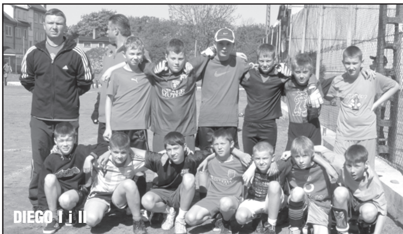
DIEGO I i II