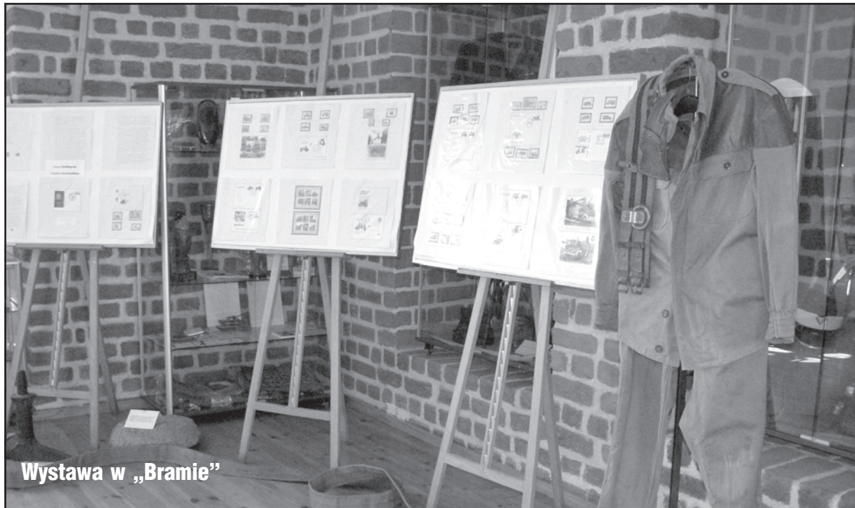
Wystawa w „Bramie”