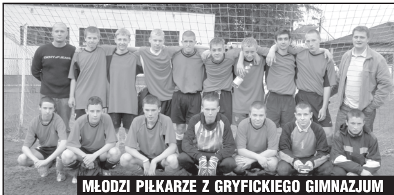
MŁODZI PIŁKARZE Z GRYFICKIEGO GIMNAZJUM

W piątek, 18 maja br., na dwóch boiskach w Gryficach administrowanych przez tutejszy ZGK, rozegrano Mistrzostwa Regionu B Szkół Gimnazjalnych w Piłce Nożnej Chłopców.