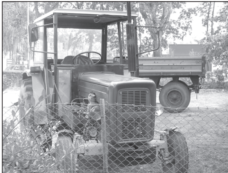
Ciągnik i przyczepa zabrane z podwórka w Tuczy stoją na parkingu w Łobzie

żeśmy się nie odwołali od tego wyroku, bo to jakoś tak uciekło z pamięci. Nie mam pretensji do sądu i komornika, ale prosiłam, by zostawili ten ciągnik chociaż miesiąc lub dwa, i tak sobie doliczą odsetki. Tłumaczę, że ojca ciągnik ma ze-