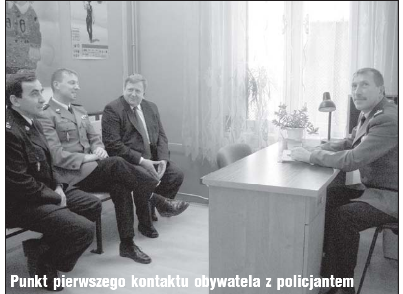
Punkt pierwszego kontaktu obywatela z policjantem

Remont pomieszczenia i wyposażenie zostało częściowo dofinansowane z powiatowego programu - „Młoda Polska Nie Bierze”. Z innych poruszanych na spotkaniu zagadnień, to realny i godny uwagi pomysł zorganizowania patroli obywatelskich. Możemy się spodziewać, że w marcu na ulicach miasta pojawią się policjanci w towarzystwie np. rodziców. Szczególnej uwadze polecamy każdą noc z piątku na sobotę, kiedy to w różnych miejscach Gryfic odbywają się dyskoteki. W przyszłym roku jest przewidziany kapitalny remont budynku, w którym swoją siedzibę ma nasza policja. Czas najwyższy, by policjant mógł pracować w dobrych i przyjaznych dla niego warunkach. x