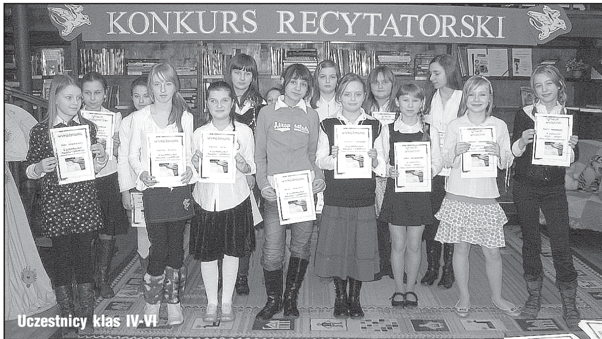
Uczestnicy klas IV-VI