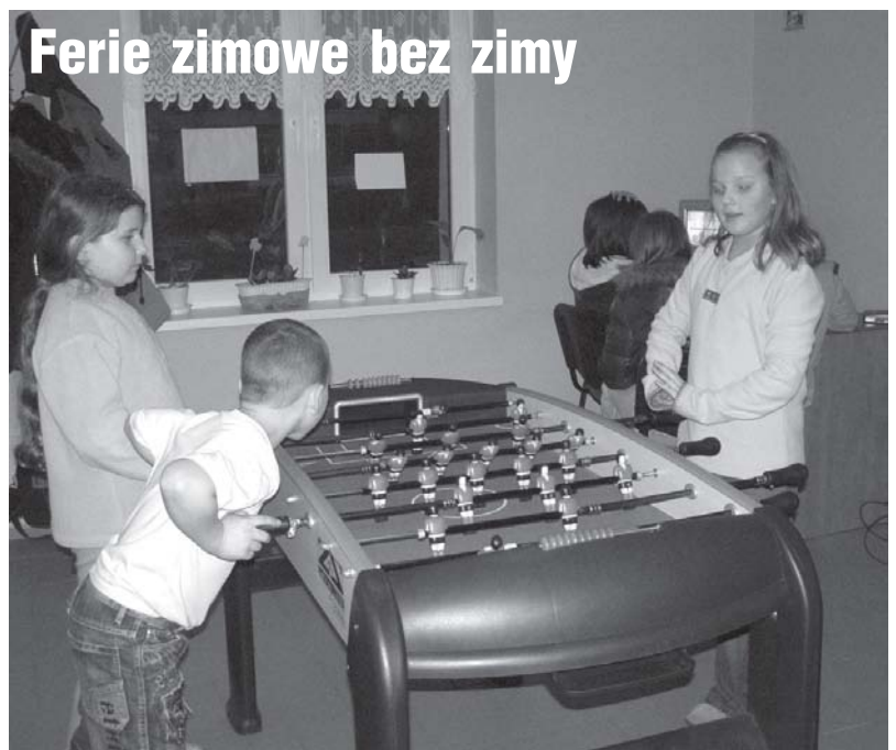
Ferie zimowe bez zimy