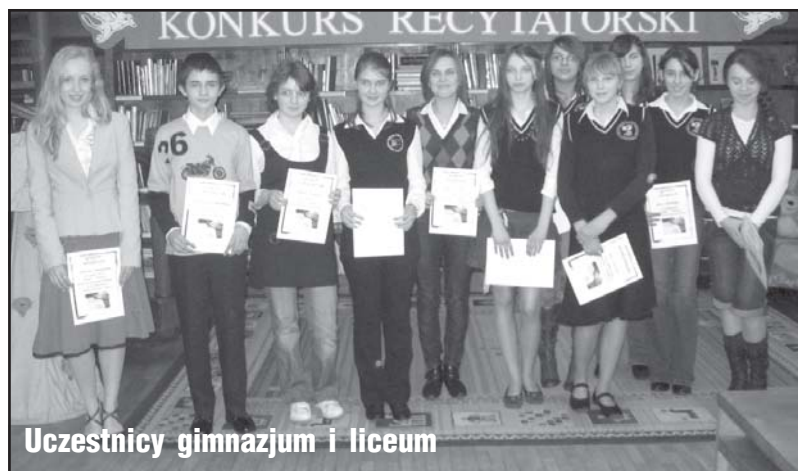
Uczestnicy gimnazjum i liceum