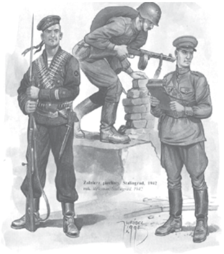
Marinara, rozbiora państwa, Pluta Białocka Ławograd. 1942 rok.