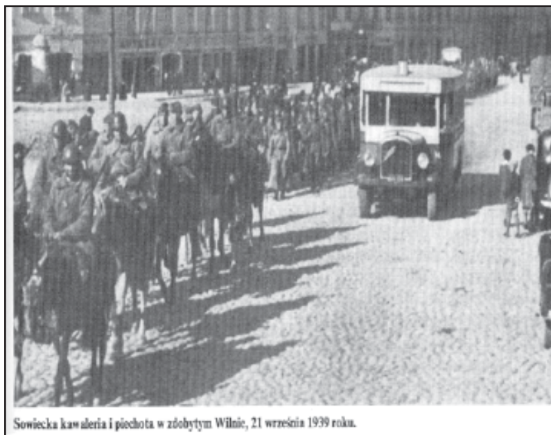
Sowiecka kawaleria i piechota w zdobytych Wilnie, 21 września 1939 roku.

niemieckie dopuszczały się wcześniej w latach 1941-1944 w ZSRR.