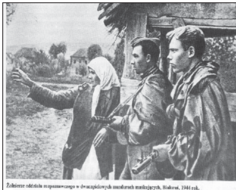
Żołnierze oddziału rozpoznawczego w dwudziestych mundurach maskujących, Białystok, 1944 rok.

Wojska sowieckie użytkowały dwa folwarki miejskie o powierzchni 67 i 225 hektarów. Zatrudniona do pracy tam była ludność niemiecka. Osoby te nie były zarejestrowane w biurze meldunkowym, co powodowało duże trudności w procesie wysiedlania Niemców w listopadzie 1945 r. Niemki pracowały w domach oficerskich jako kucharki i służące. Stosunek ludności polskiej do wojsk radzieckich uległ gwałtownemu zastrzeżeniu, po zamordowaniu żołnie-