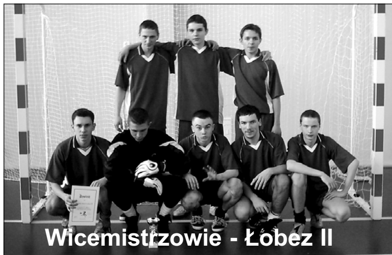
Wicemistrzowie - Łobez II