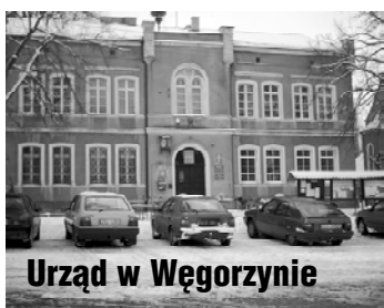
Urząd w Węgorzynie

Październik roku 2004 – Z umowy gminy Węgorzno wyszły przystawione nici, nawet nie rozpoczęto prac projektowych. Natomiast w firmie PETRICO nastąpiły rewolucyjne zmiany. Z firmy odszedł jej prezes, a ona sama stała się w większości własnością niemiecką. W nowej sytuacji prawnej PETRICO, mimo iż nie wywiązało się z poprzedniej umowy, przystąpiło do nowej ofensywy inwestycyjnej. Zaproszonym do swojej siedziby w Karlinie burmistrzom Węgorzyna, Chociwla i Ińska zaproponowano wybudowanie na ich terenie sieci gazowniczych zasilanych wysokim ciśnieniem od strony Łobza, a więc gazem wysokokalorycznym. Warunkiem stawianym przez PE-