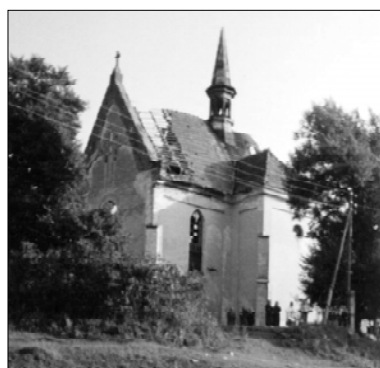
Kościół przed remontem 21.08.2003 r.

Stowarzyszenie Kresowian z Kuropatnik woj. Tarnopol.