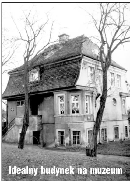
Idealny budynek na muzeum