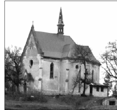
Kościół po remoncie dachu 03.12.2004 r