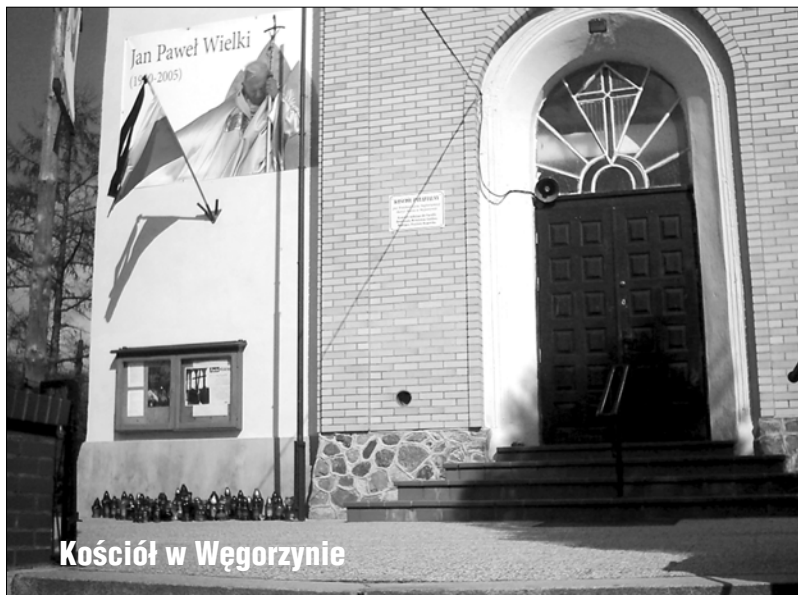
Kościół w Węgorzynie