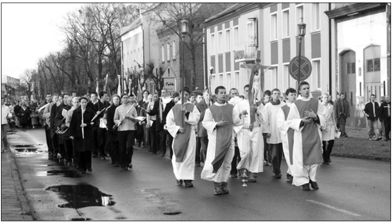
Ministranci, księża, Łobeska Orkiestra Dęta