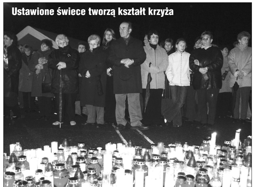
Ustawione świece tworzą kształt krzyża

ukazały się dwie książki biograficzne o papieżu różnych autorów, które były szeroko omawiane i komento-