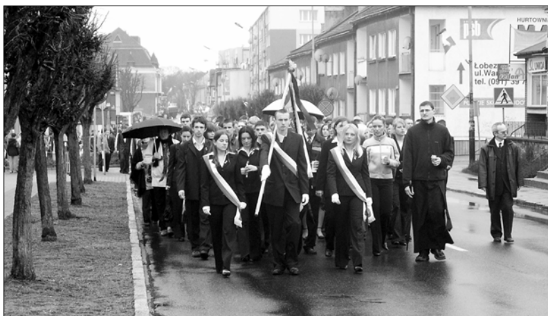
Licealiści idą na Mszę św.

- Mam nadzieję, że będziemy realizować to, o czym mówił i pisał papież, bo jak nie, to okażemy się ludźmi małego formatu. To wymaga zmian. Te zmiany trzeba zacząć od siebie, trzeba zacząć zmieniać się samemu. - odpowiedział pan Mechliński na pytanie o znaczenie przesłania zawartego w naukach papieża. KAR