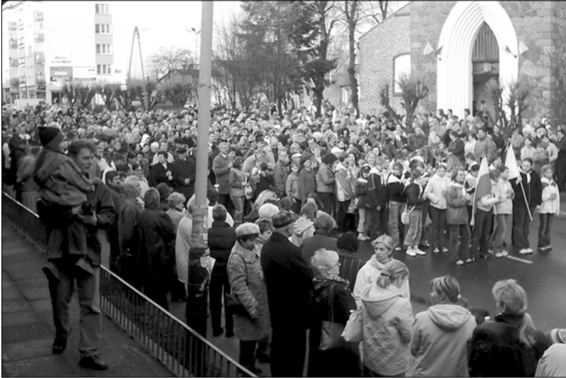
Wierni zbierają się przed kościołem