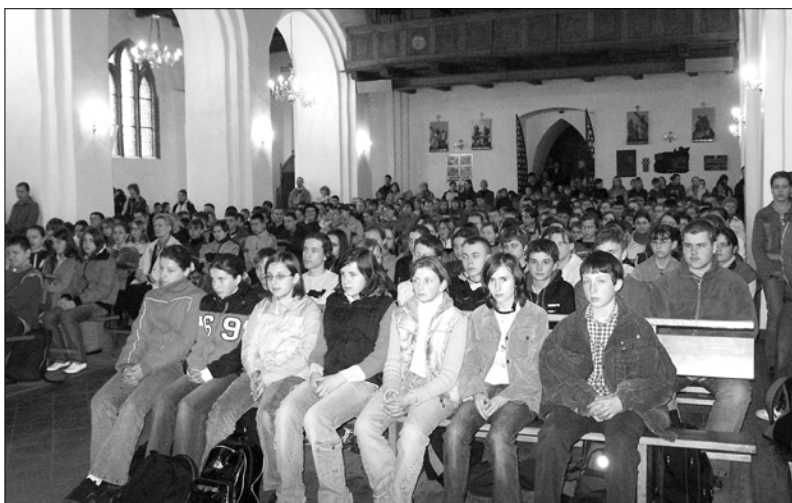
Gimnazjaliści i uczniowie szkół podstawowych