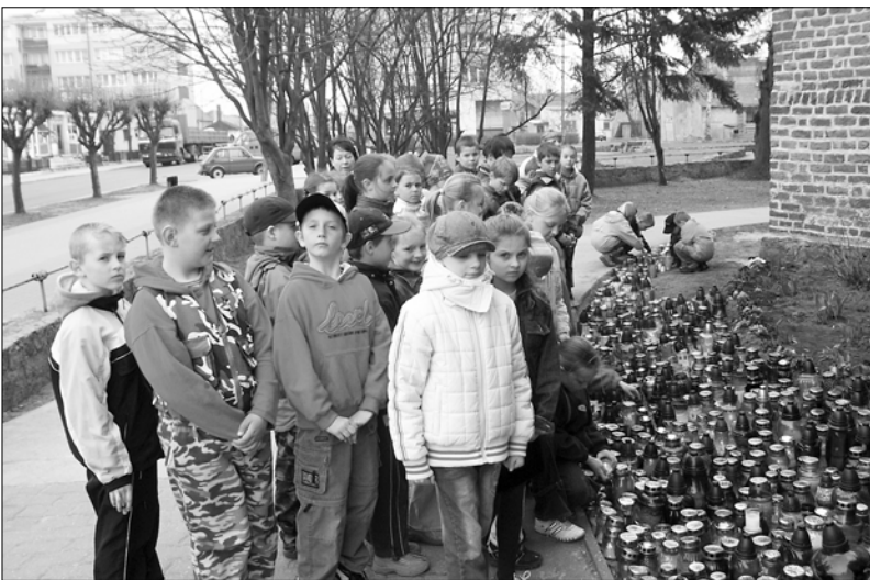
Przystają, zapalają świece, modlą się.