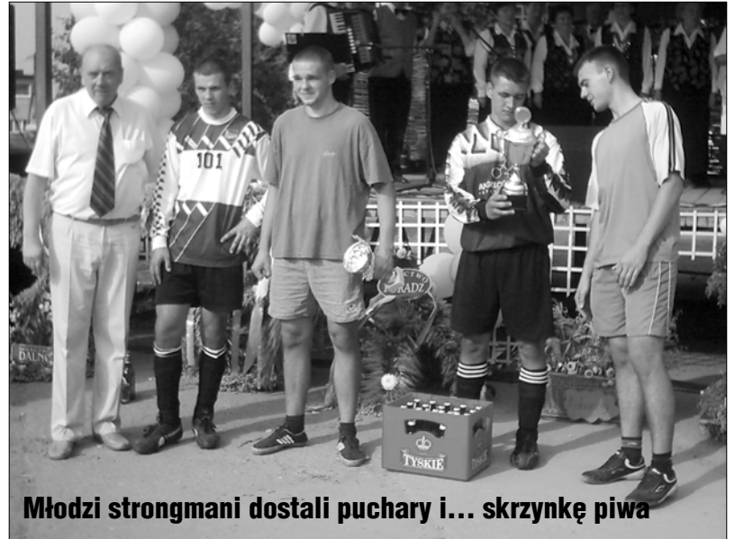
Młodzi strongmani dostali puchary i... skrzynkę piwa