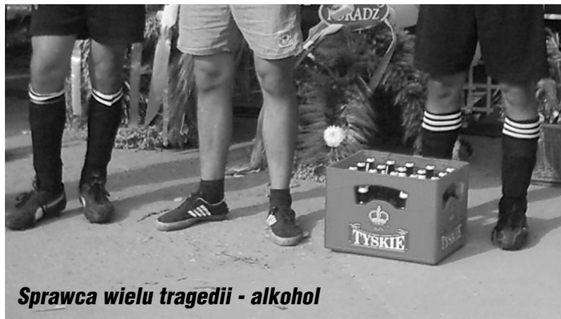
Sprawca wielu tragedii - alkohol