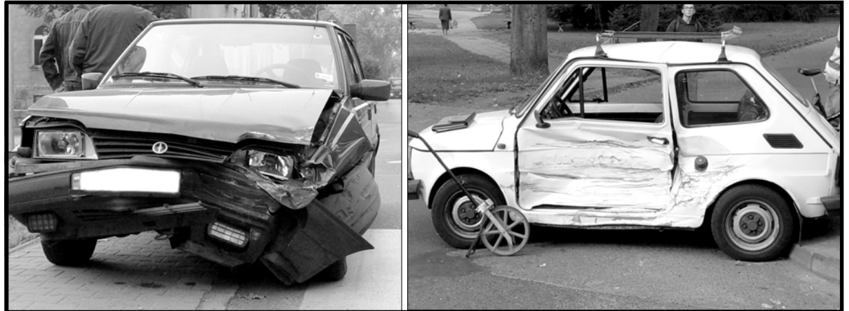
Skrzyżowanie ulicy Segala z ulicą Niepodległości we wtorek rano

(ŁOBEZ) Na skrzyżowaniu ulic Segala i Niepodległości wciąż dochodzi do kolizji. To pokłosie zmiany ruchu, do jakiej doszło w lipcu br. Od tamtej pory w tym miejscu doszło już do 8 kolizji. Cudem można nazwać to, że do tej pory na tym skrzyżowaniu obyło się bez ofiar śmiertelnych.