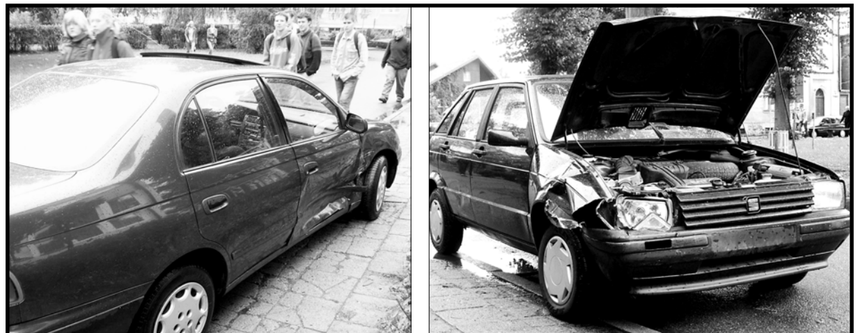
Skrzyżowanie ulicy Segala z ulicą Niepodległości w czwartek