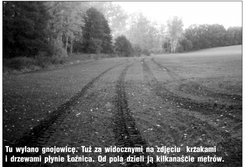
Tu wylano gnojowicę. Tuż za widocznymi na zdjęciu krzakami i drzewami płynie Łoźnica. Od pola dzieli ją kilkanaście metrów.

W starostwie nieuchwytny był w tym dniu dyrektor Wydziału Ochrony Środowiska. Jedną z pracownic powiedziała nam, że nic nie wie, by w sprawie smrodu wpłynęły jakieś pisma.