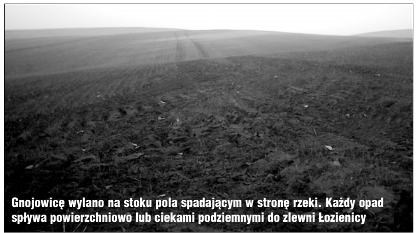
Gnojowicę wylano na stoku pola spadającym w stronę rzeki. Każdy opad spływa powierzchniowo lub ciekami podziemnymi do zlewni Łoźnicy