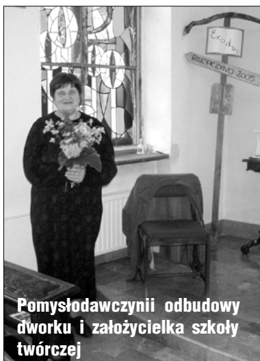
Pomysłowczyni odbudowy dworku i założycielka szkoły twórczej