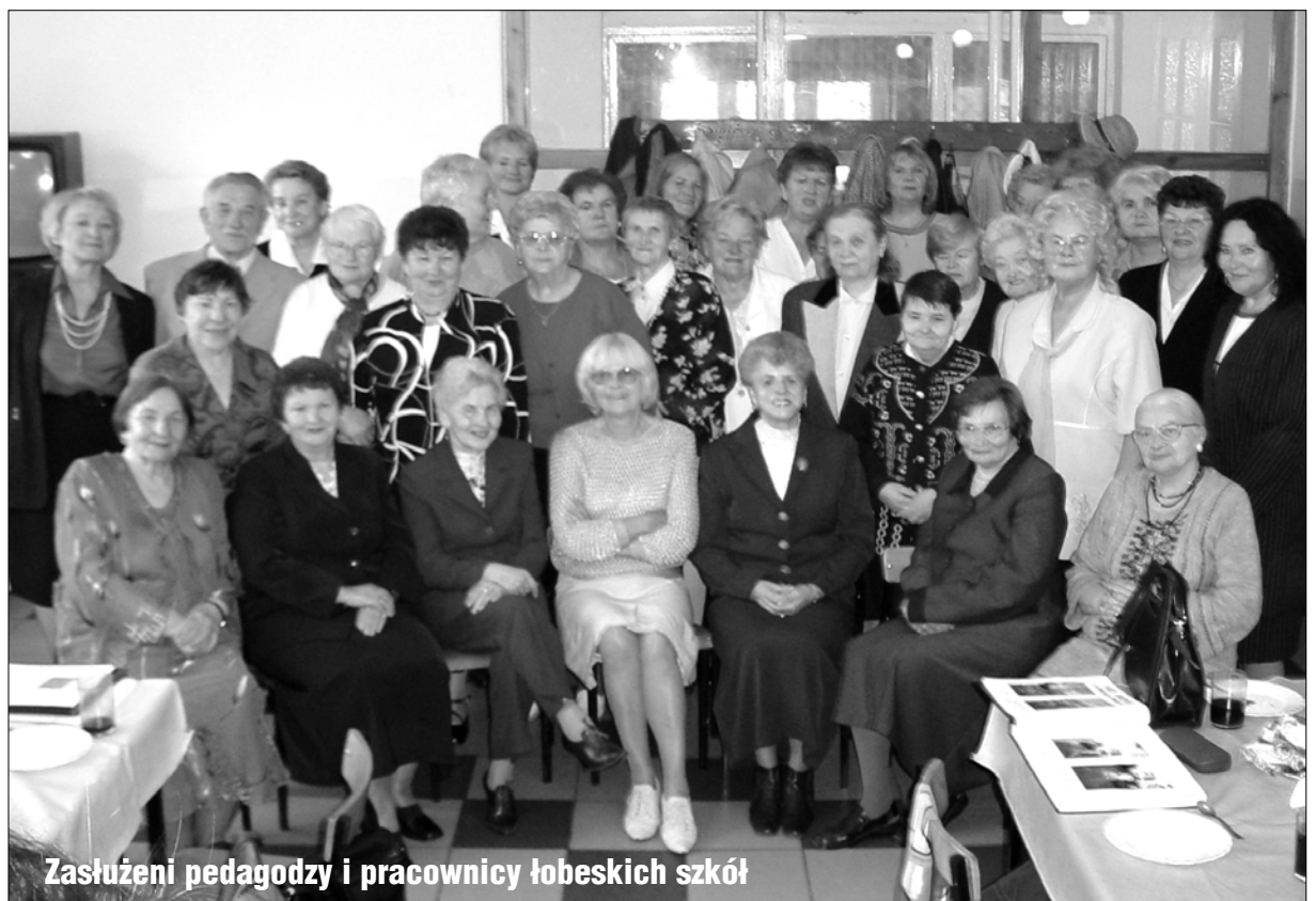
Zasłużeni pedagodzy i pracownicy łobeskich szkół

Po tej wzruszającej dla wielu osób uroczystości nastąpiło spontaniczne odśpiewanie „Hymnu Emerytów” oraz wielu innych piosenek. Na koniec goście zostali zaproszeni na uroczysty obiad. Sylwia Maczan