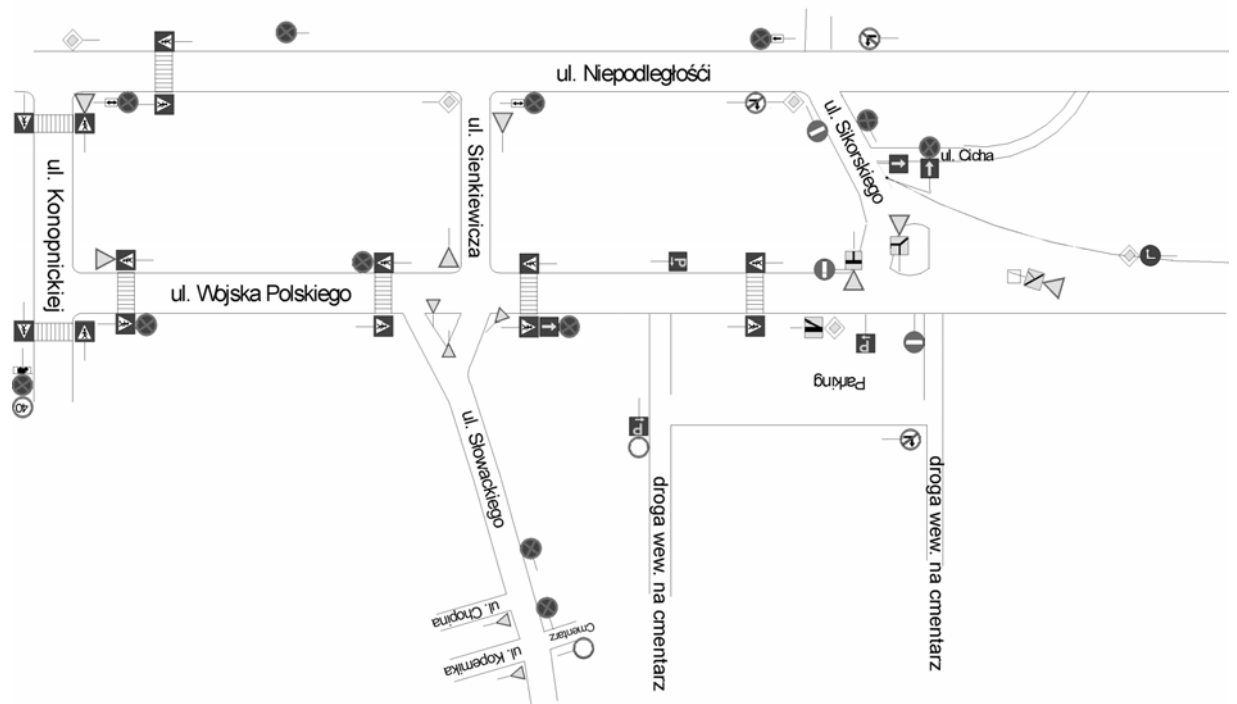
Plan projektowanej tymczasowej organizacji ruchu na ulicach: Wojska Polskiego, Sienkiewicza, Słowackiego, Sikorskiego, M. Konopnickiej w Łobzie