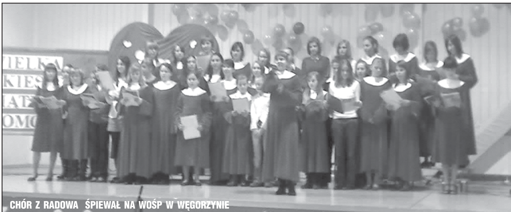
CHÓR Z RADOWA ŚPIEWAŁ NA WOŚP W WĘGORZYNIE

WĘGORZYNO. W tym mieście doszło do swoistego kuriozum – Orkiestra zagrała bez serduszek i podstawowych gadżetów. Te zamiast trafić do Węgorzyna – pojechały do... Węgorzowa.