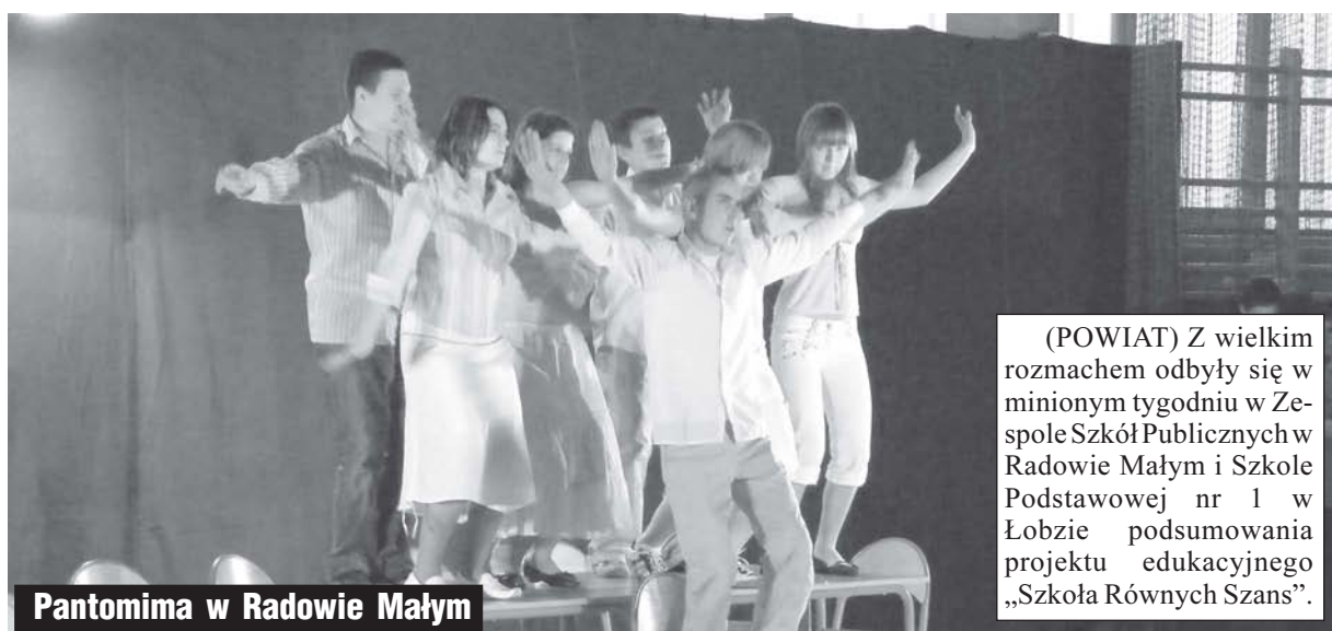
Pantomima w Radowie Małym

(POWIAT) Z wielkim rozmachem odbyły się w minionym tygodniu w Zespole Szkół Publicznych w Radowie Małym i Szkole Podstawowej nr 1 w Łobzie podsumowania projektu edukacyjnego „Szkoła Równych Szans”.