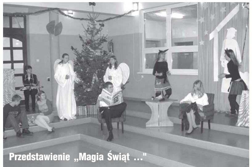
Przedstawienie „Magia Świąt ...”