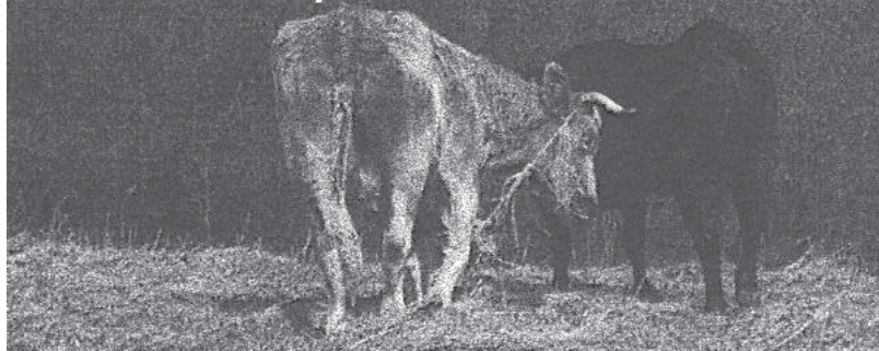
Polowanie na... krowy