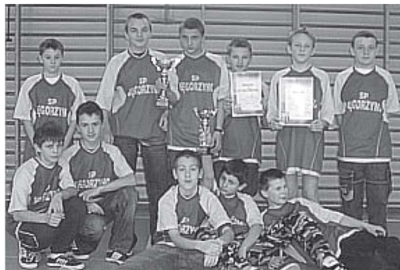
Obronili tytuły mistrzów powiatu zdobyte przez SP Węgorzyno w ubiegłym roku szkolnym.

29 stycznia w Dobrej Nowogardzkiej odbyły się mistrzostwa powiatu w piłce ręcznej szkół podstawowych. W kategorii chłopców bezkonkurencyjną okazała się reprezentacja SP Węgorzyna odnosząc komplet zwycięstw. Skład