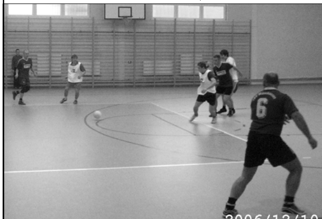
TABELA ROZGRYWEK DALP 2006/2007