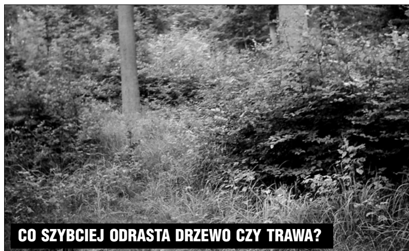
CO SZYBCIEJ ODRASTA DRZEWO CZY TRAWA?

Trudno wierzyć w czyste intencje autorki listu, która opisując jednostkowy przypadek stawia zarzuty całej organizacji. Czy nie lepiej zwrócić uwagę na miejscu zdarzenia, niż pisać tego typu głupoty? Tak postąpiłby ktoś normalny, nie zżerany nie-