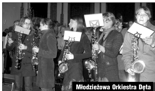
Młodzieżowa Orkiestra Dęta