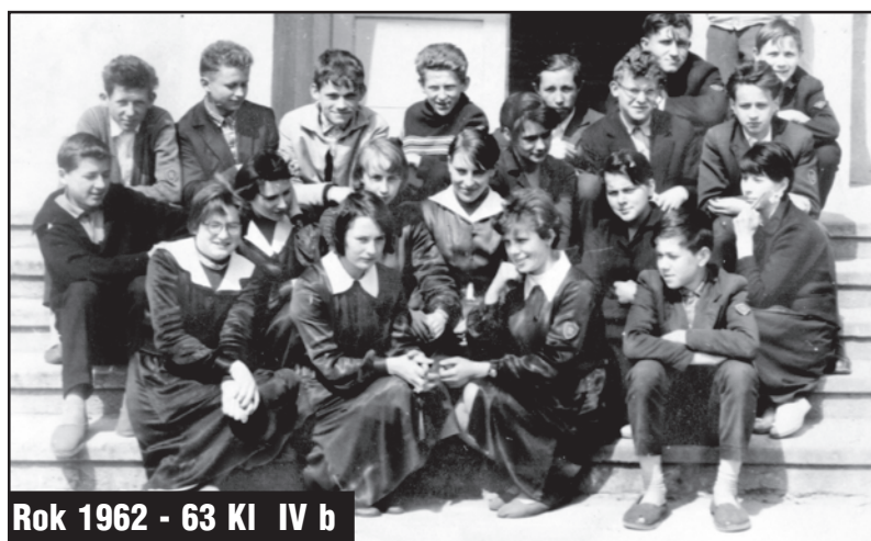
Rok 1962 - 63 Kl IV b