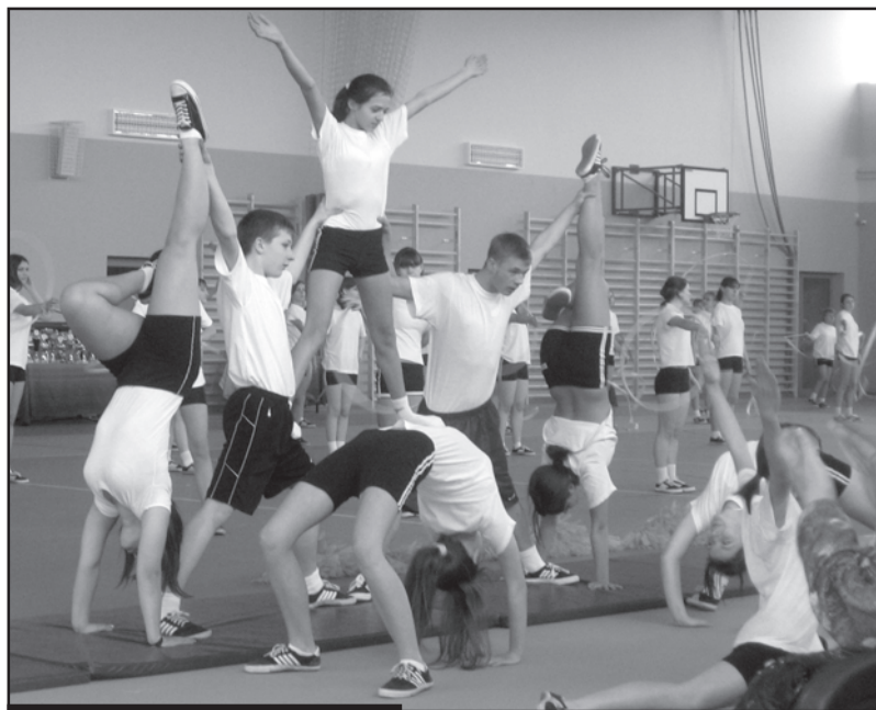
Pokaz sportowy i artystyczny