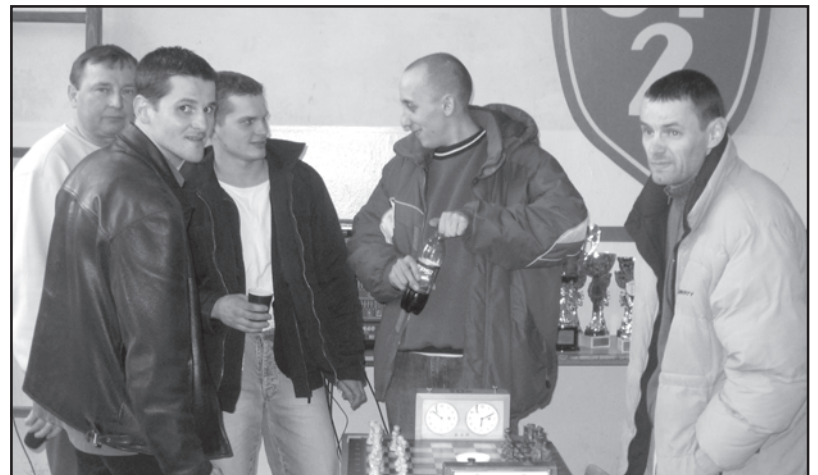
Rodzina Nadkiernicznych z Węgorzyna oprócz piłki grywa także namiętnie w szachy