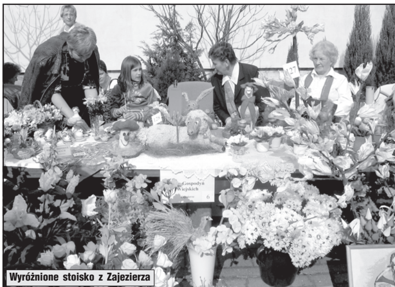
Wyróżnione stoisko z Zajezerza