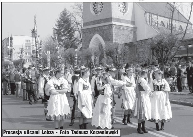
Procesja ulicami Łobza

„Łobeską Babę Wielkanocną” zorganizowano na placu przed biblioteką. Umiejscowienie jarmarku w niedzielę handlową zaowocowało przybyciem sporej liczby mieszkańców Łobza, którzy wybierając się na niedzielny spacer mieli okazję do kupienia świątecznych ozdób, spróbowania wielkanocnych oryginalnych specjalów, czy też po prostu obejrzenia interesujących prac rękodzielniczych. Jarmark stał się też okazją do zaprezentowania swoich talentów przez ludzi, którzy tworzą w domowym zaciszu, nie mając zbyt okazji do pokazania się. Obok nich stanęły stoiska ekip traktujących swoją działalność poważnie. Tak jak choćby stanowisko Koła Gospodyń Wiejskich z Zajezerza. W czasie konkursu przeprowa-