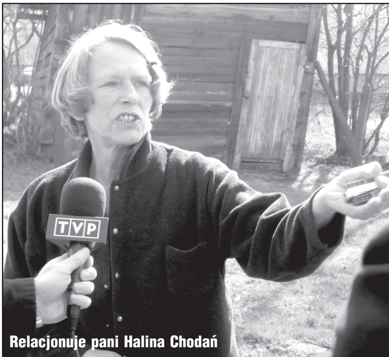
Relacjonuje pani Halina Chodań

Prawie tydzień po podpaleniu policja wciąż poszukuje sprawcy. Komendant KPP w Łobzie Zbigniew Podgórski wyznaczył 3 tys. zł nagrody za pomoc w ujęciu podpalacza. Policja oczekuje na jakąkolwiek informację od mieszkańców. Powołana została grupa operacyjna złożona z policjantów komendy wojewódzkiej i łobeskiej, która intensywnie pracuje nad sprawą. Mieszkańcy są w szoku. Moi rozmówcy wciąż nie potrafią wytłumaczyć sobie, że w Dobrej do czegoś takiego mogło dojść. KAR