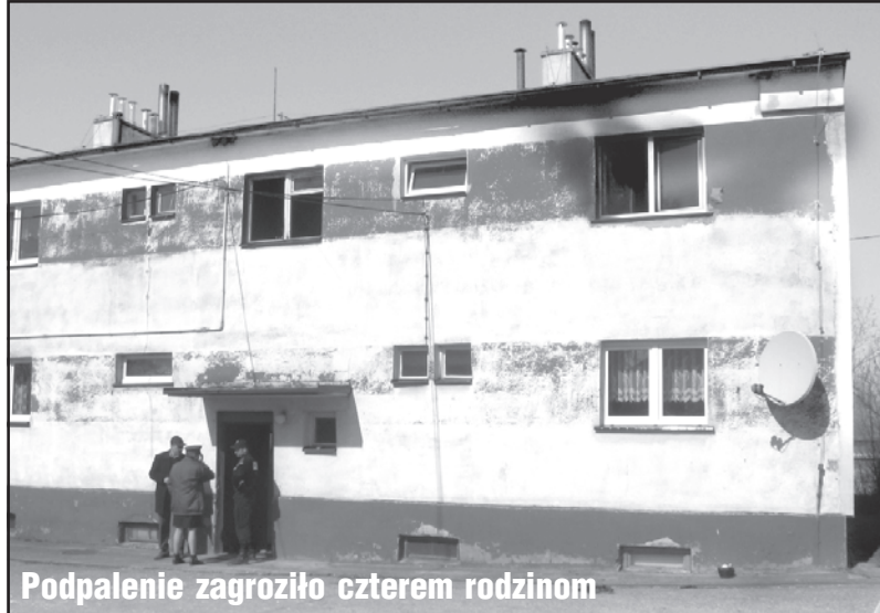
Podpalenie zagroziło czterem rodzinom

W budynku mieszkają cztery rodziny. Mieszkanie burmistrz znajduje się na piętrze. Widać osmaloną ścianę nad oknem. Musiał się tędy wydobywać dym. Z drugiej strony to samo. Na trawniku leży zwęglony drewniany wieszak. Gdy wybuchł