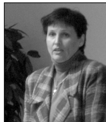
kończąc dyskusję zobligował dyrektor ŁCT do przedstawienia radzie celów jednostki na papierze.