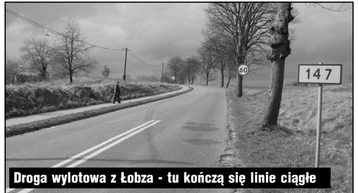
Droga wylotowa z Łobza - tu kończą się linie ciągłe

W tym ostatnim przypadku już dawno powinien stać przed tym skrzyżowaniem znak zakazu wyprzedzania. I pomyśleć, że jeszcze niedawno nie było tam nawet namalowanych linii ciągłych! Okazuje się, że taki wniosek wyszedł dopiero z Komendy Powiatowej Policji 14 czerwca 2006 roku. Wysłał go naczelnik sekcji ruchu drogowego Henryk Michalski do Rejonu Dróg Wojewódzkich w Gryficach, któremu droga podlega. Wniosekował, by