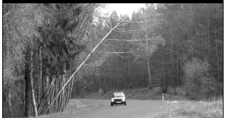
Droga na Strzmieli - drzewo przez dwa tygodnie wisiało nad drogą