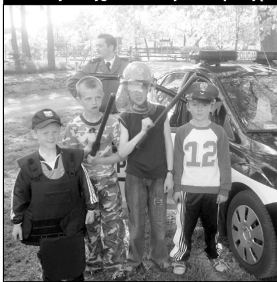
Młodzieżowe Ochotnicze Rezerwy Policji