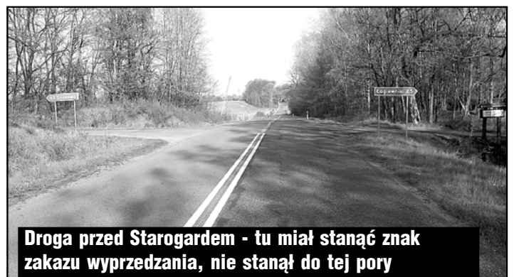
Droga przed Starogardem - tu miał stanąć znak zakazu wyprzedzania, nie stanął do tej pory