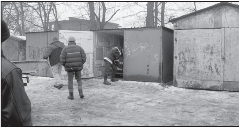
Eksperyment potwierdził podejrzenia prokuratury