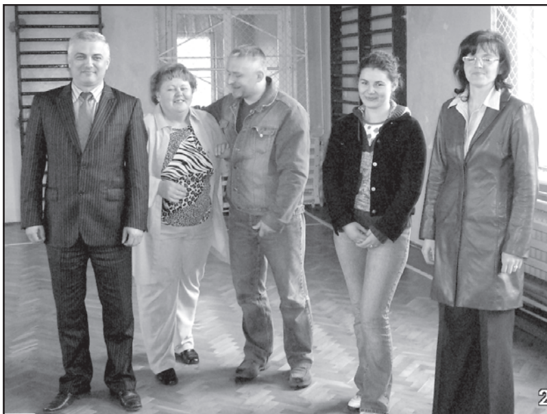
Foto poniżej: Łabuń - burmistrz z nowym sołtysiem i Radą Sołecką.