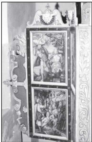
Lewe skrzydło zewnętrzne zawiera obrazy: „Ofiarowanie Izaaka”, „Mojżesz i wydobywanie wody ze skały” w renesansowym obramowaniu.

Późnośredniowieczny dwuskrzydłowy ołtarz jest skonstruowany zgodnie ze sztuką średniowiecznych ołtarzy drewniano-skrzynkowych, z podzielnymi skrzydłami. Ołtarz ma kształt szafki, zaś skrzydła boczne ołtarza są jednakowej wysokości i kształcie prostokątnym. Zarówno w relikwiarzu jak i w skrzydłach pod złotymi liśćmi umieszczone są barwne grupy figur drewnianych. W relikwiarzu rzeźba ukrzyżowanego Chrystusa z żałobnikami: Maryją i Janem, natomiast na skrzydłach przedstawione są sceny z dzieciństwa Chrystusa w formie płaskorzeźby. Poprzez oddzielenie dolnej części ołtarza ornamentami florystycznymi stworzono odpowiednią przestrzeń dla figur w relikwiarzu. Na zewnętrznej części skrzydeł znajdują się po dwa obrazy, na których przedstawiono cztery wydarzenia opisane w Starym Testamencie. Rozbudowując tryptyk w pentaptyk uzyskano rozbudowany program treściowy. Przy zamkniętych skrzydłach ołtarza widoczne są wszystkie cztery obrazy.