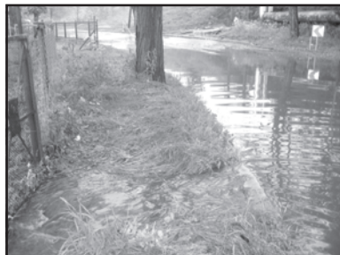
Zalane ogródki nad Regą

ko. Odpływała do Regi przez ogródki, niszcząc zasiewy. Zapowiadana na drugi dzień powtórka burzy na szczęście nie nastąpiła. (r)