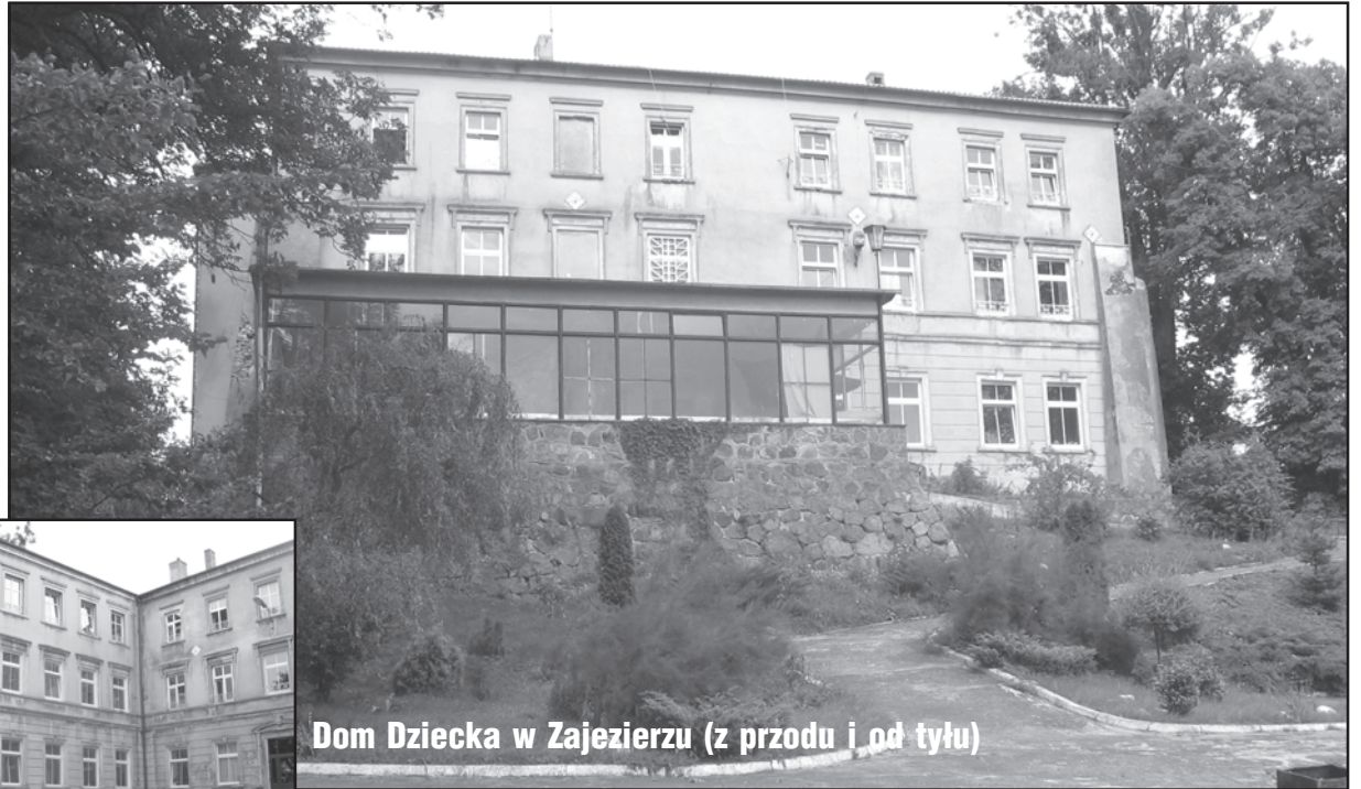
Dom Dziecka w Zajezerzu (z przodu i od tyłu)

- Miałem sporo wątpliwości, które wyjaśniłem na trzygodzinnym