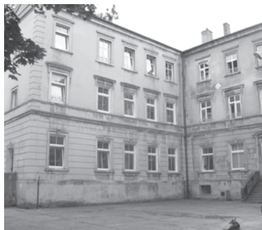
Dom dziecka w Zajezierzu