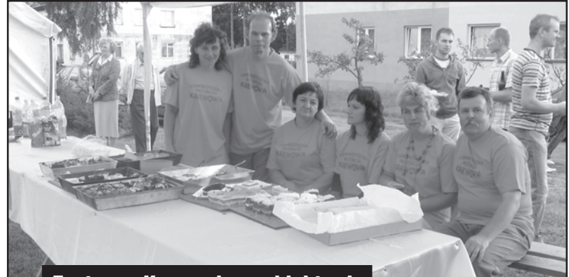
Festyn w Karwowie w obiektywie