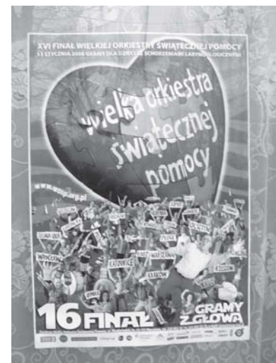
Finał WOŚP odbędzie się również w szkole w Betczej. MM

Zaangażowani będą również łobescy burmistrzowie, którzy mają kwestować dla milusińskich na terenie miasta.