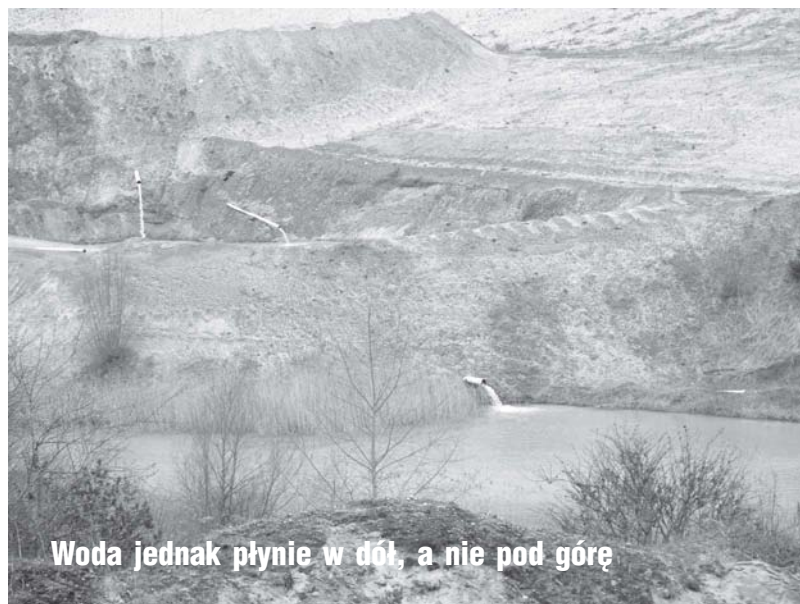
Woda jednak płynie w dół, a nie pod górę