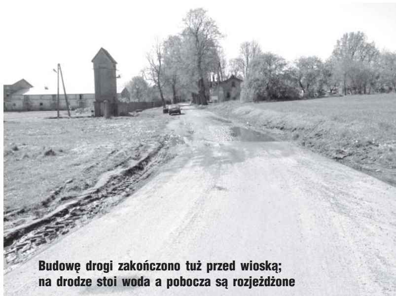
Budowę drogi zakończono tuż przed wiosną; na drodze stoi woda a pobocza są rozjeżdżone

W Gardnie funkcjonuje firma produkująca karmy dla psów. Aby mówić o dobrej logistyce konieczna jest droga, trudno mówić o czymkolwiek, jeśli jest jedynie ślad po drodze. W przyszłości powstanie kolejna firma, w miejscu po byłym PGR. Obecnie już trwają prace remontowo-budowlane. Ma tu powstać ośrodek konny i hotel. Trudno jednak wymagać od wszystkich przyjezdnych i mieszkańców, by zakupili samochody terenowe w ramach uczczenia sukcesu gminy. (mm)