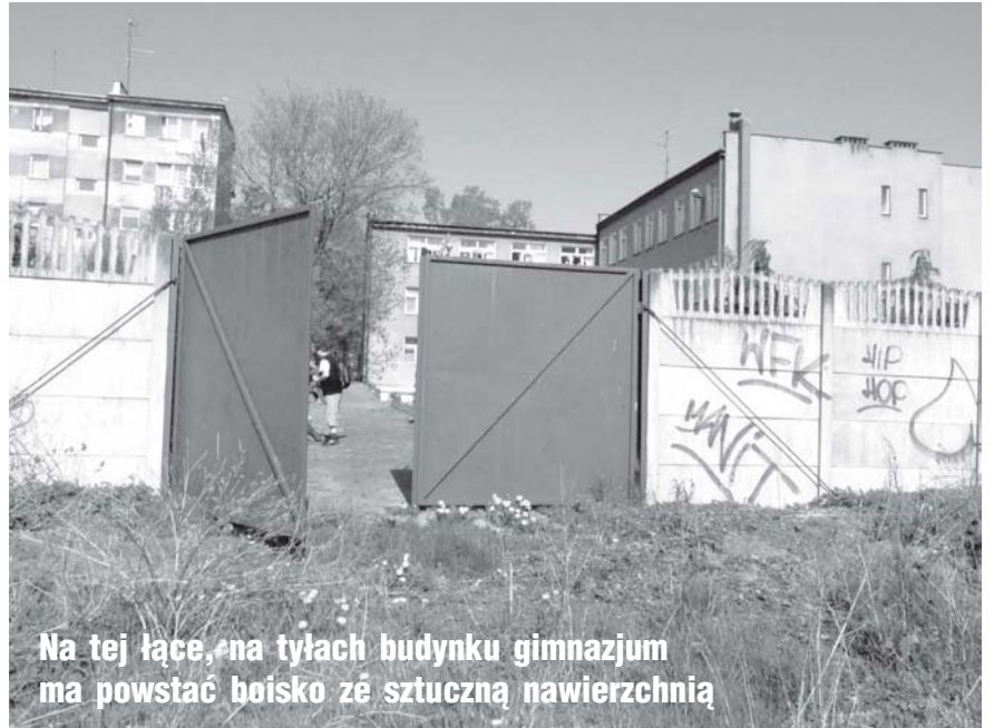
Na tej łące, na tyłach budynku gimnazjum ma powstać boisko ze sztuczną nawierzchnią

niewiadomo jakich i gwarancji na przyszłość – powiedziała wiceprzewodnicząca.