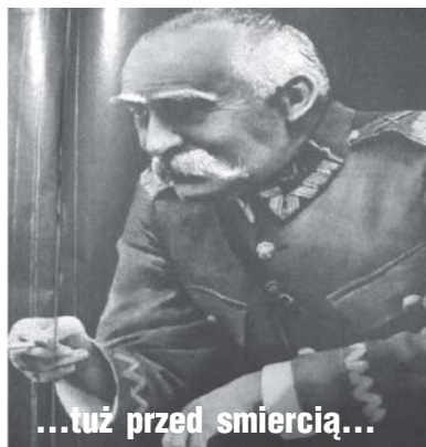
...tuż przed śmiercią...

Kazimierz Chodkiewicz, słynny ezoteryk 20-lecia międzywojennego,