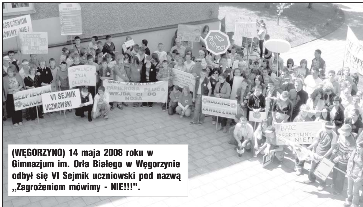
(WĘGORZYNO) 14 maja 2008 roku w Gimnazjum im. Orła Białego w Węgorzynie odbył się VI Sejmik uczniowski pod nazwą „Zagrożeniom mówimy - NIE!!!”.