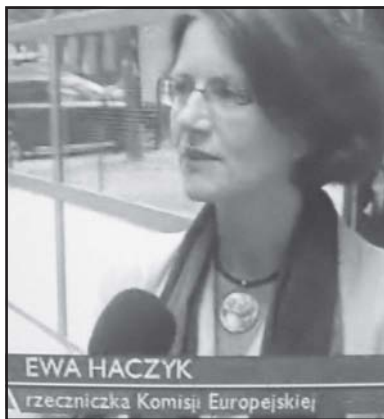
EWA HACZYK rzeczniczka Komisji Europejskiej