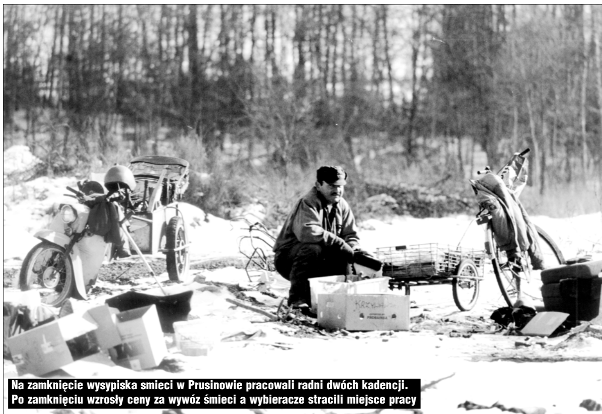
Na zamknięcie wysypiska smieci w Prusynowie pracowali radni dwóch kadencji. Po zamknięciu wzrosły ceny za wywóz śmieci a wybieracze stracili miejsce pracy

ciągu roku siłą rzeczy ułożył się sam w kalendarium wydarzeń. Nie mogliście o nich przeczytać w innych gazetach, dlatego przypominamy je w skrócie, by pokazać, jak przeżarta jest nasza lokalna rzeczywistość pazernością i głupotą; jak trapiąca była absurdami i skandalami, a z drugiej strony walką zwykłych mieszkańców o ich ujawnienie i napiętnowanie. Ta zdolność do reakcji na urzędniczą głupotę, na chorobliwą ambicję władzy, na pazerność i chciwość małych ludzi, sprawia, że jeszcze możemy czuć się małą wspólnotą lokalną i z dumą myśleć o sobie. O sobie, jako