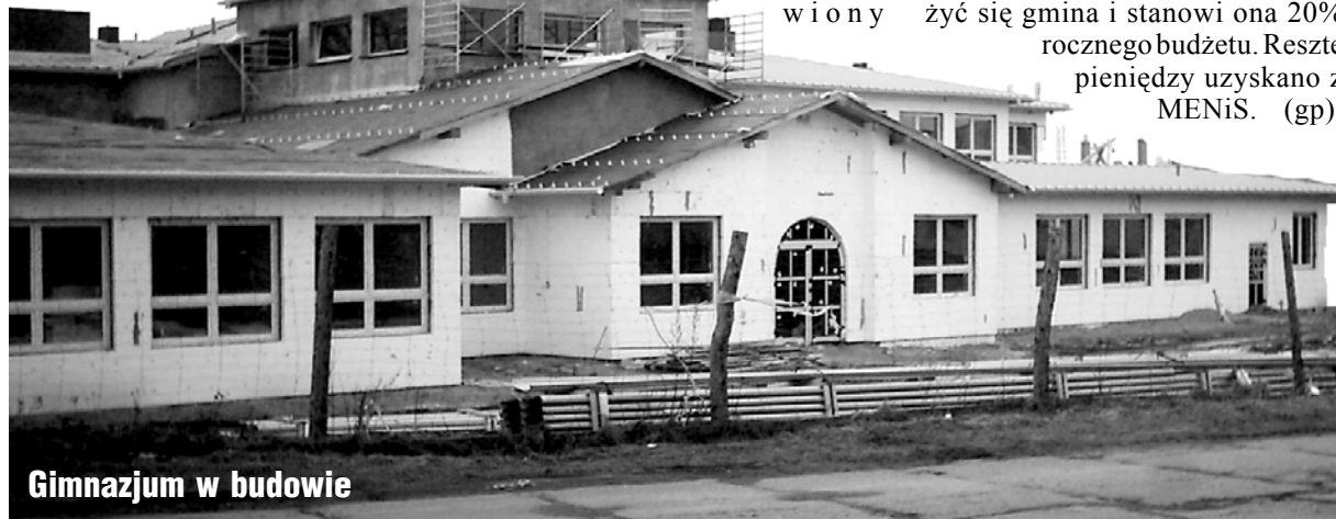
Gimnazjum w budowie

Gmina zaciągnęła również kredyt na budowę hali sportowej w wysokości 3 173 tys. zł. Jest to maksymalna kwota jaką mogła zadłużyć się gmina i stanowi ona 20% rocznego budżetu. Resztę pieniędzy uzyskano z MENiS. (gp)